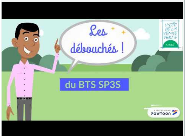
Les debouches du BTS SP3S (Video Youtube)