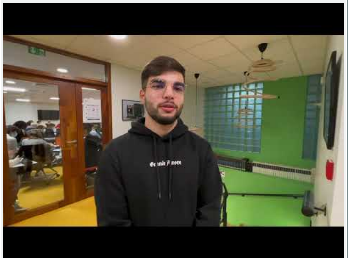
2 BTS SP3S Edvin ST2S STAPS BPJEPS (Video Youtube)

Témoignage de Laura, étudiante de 2ème année