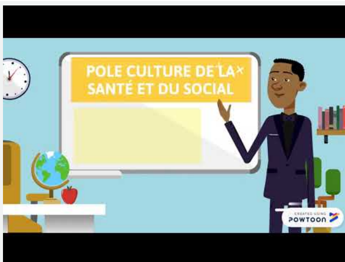
Présentation BTS SP3S - Lycée de la Venise Verte (Video Youtube)