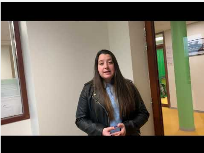
5 BTS SP3S Camille ASSP CAP petite enfance (Video Youtube)

présentation des débouchés après un BTS SP3S