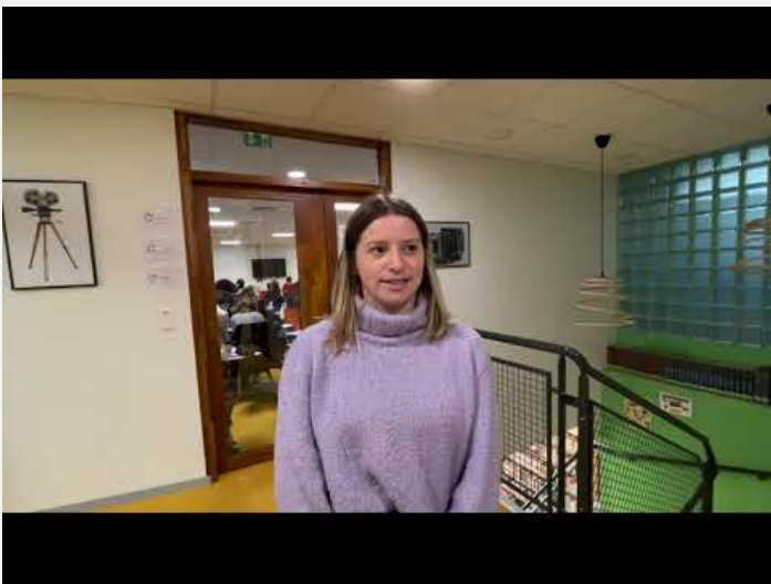
1 BTS SP3S Chloe ST2S Insertion Pro (Video Youtube)