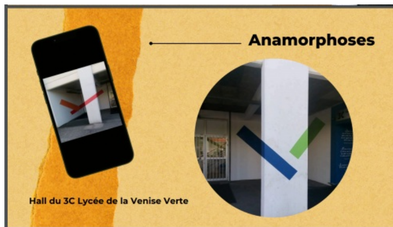
Exemples de production