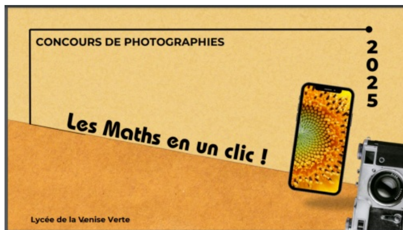
Affiche du concours photo "Les maths en un clic"

Ouvert aux lycéens et aux étudiants ainsi qu'au personnel enseignant et non enseignant, ce concours permet de poser un regard différent, avec un angle mathématique, sur leur environnement.