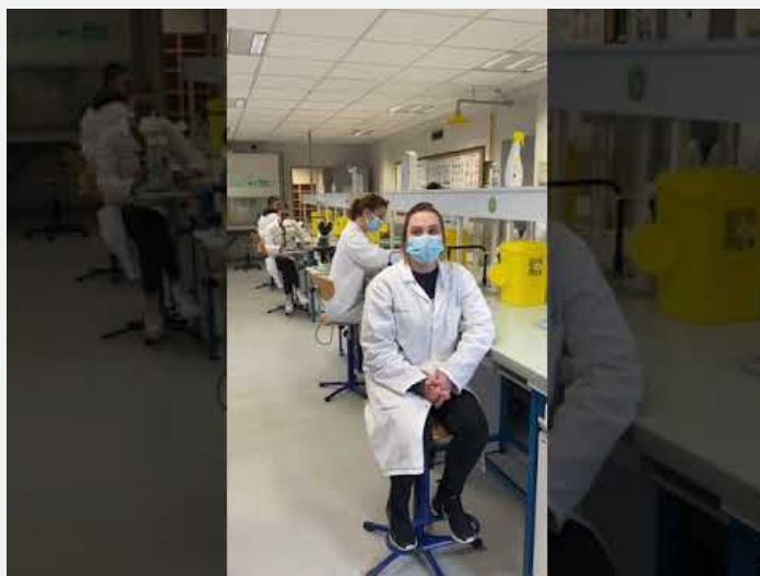
Présentation du BTS BM, Merine ( Video Youtube )