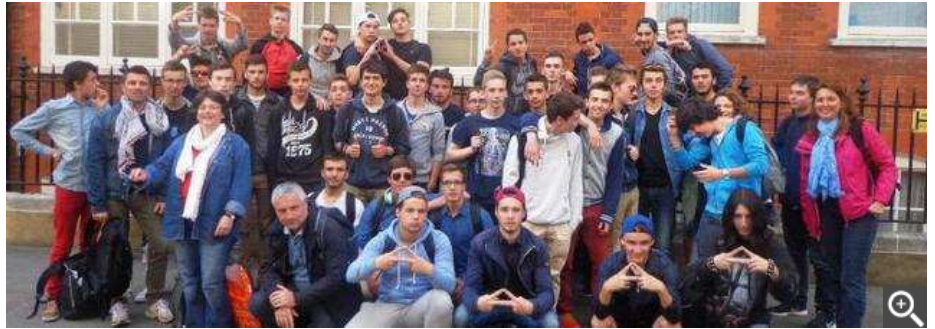
Pose photo souvenir avec les accompagnateurs dans une rue tranquille de Londres.