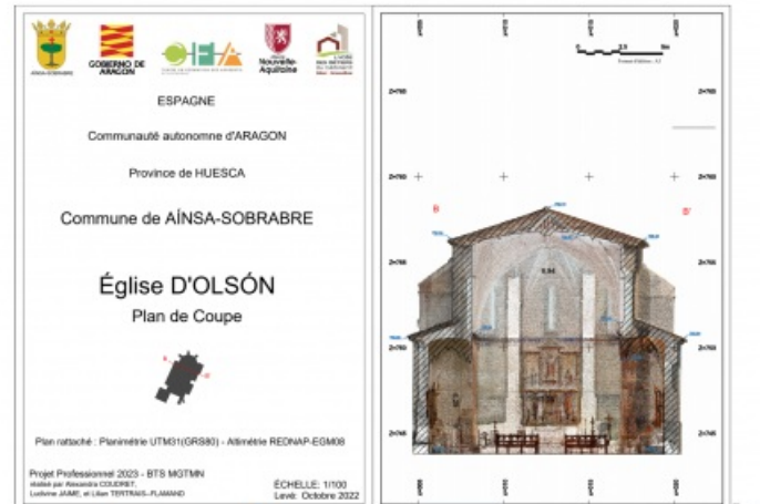
4: Présentation de la coupe verticale de l'Église