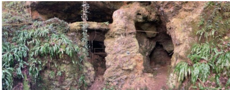
La grotte se situe dans le village de La Chaize dans la Commune de Vouthon. Cette commune est située à une trentaine de kilomètres à l'est d'Angoulême. Ce site a fait l'objet de plusieurs fouilles archéologiques.

Ce projet permet la mise en valeur touristique du site.