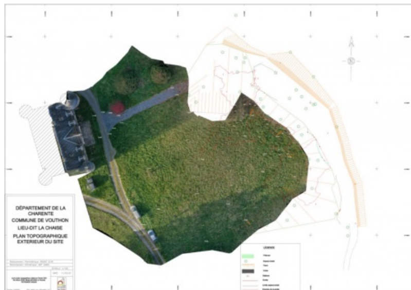
Le plan topographique avec l'orthophoto de la partie supérieure de la grotte de la Chaise

L'objectif est de générer une modélisation numérique de terrain à l'aide de la photogrammétrie et des photographies prises depuis un drone et la caméra 360 dans le but d'obtenir un modèle 3D complet de la grotte sans oublier l'usage du tachéomètre.