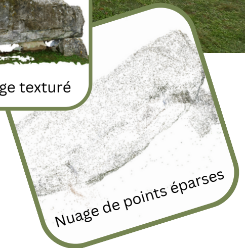
Nuage de points éparses