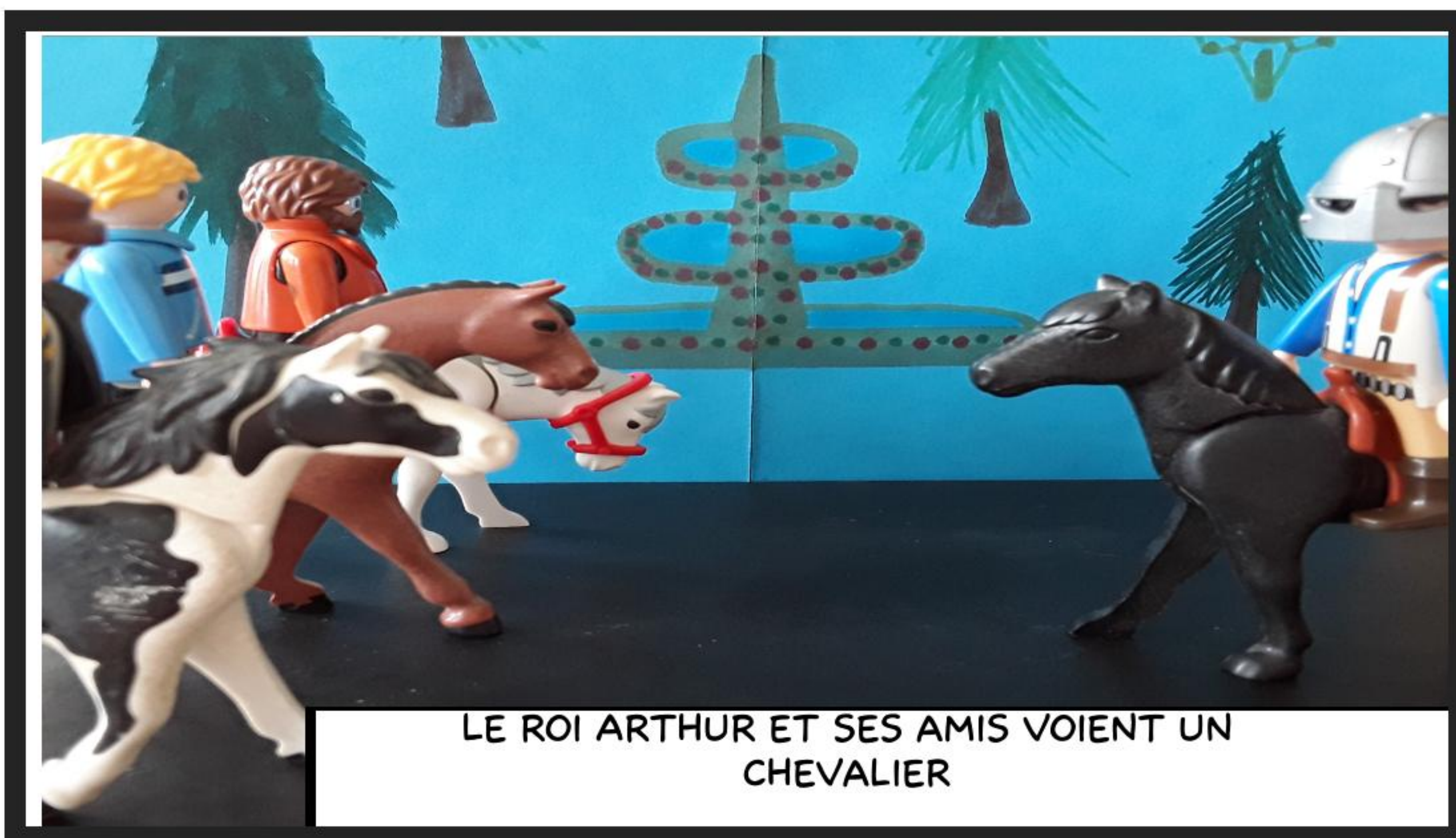
LE ROI ARTHUR ET SES AMIS VOIENT UN CHEVALIER