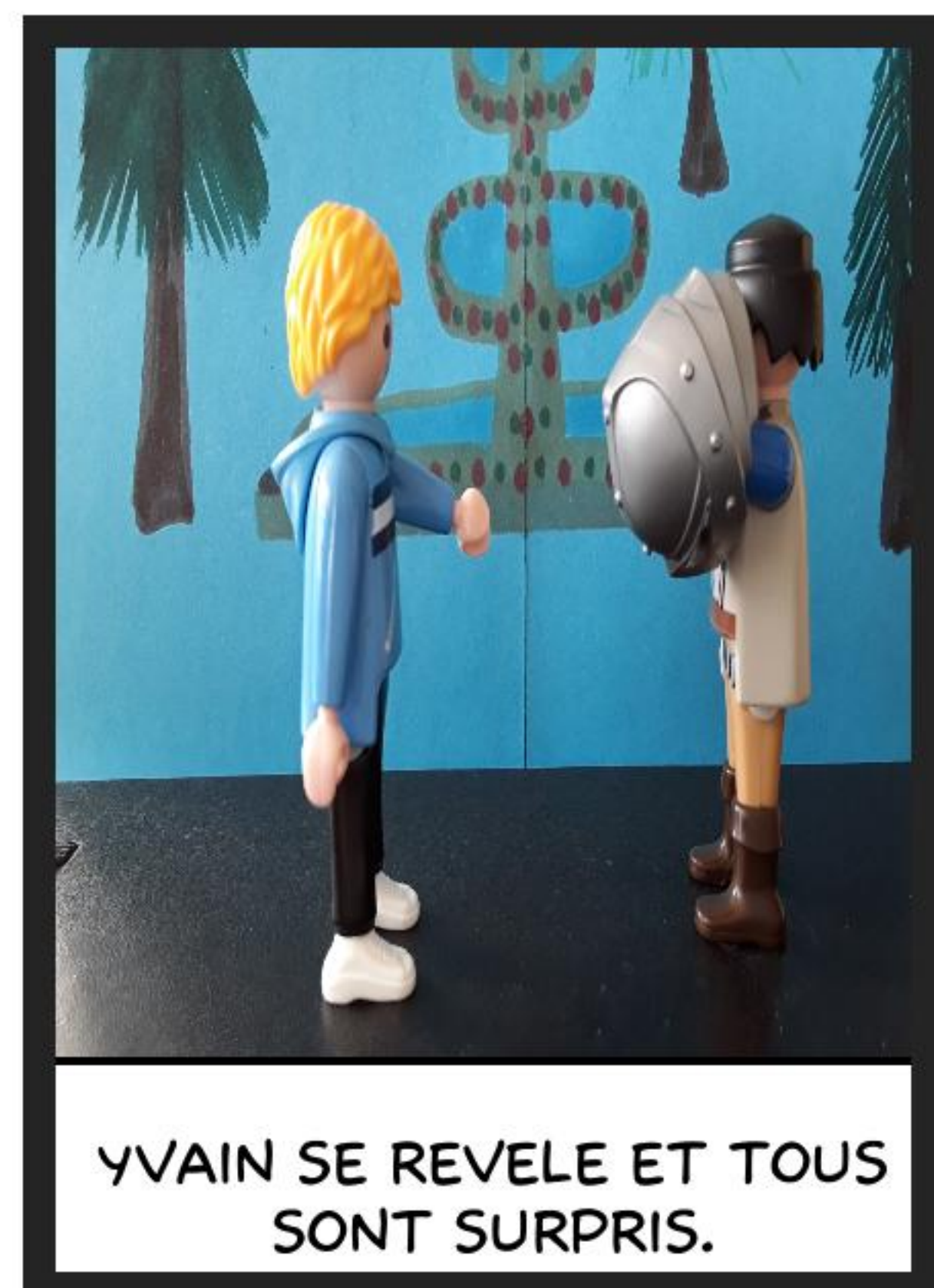
YVAIN SE REVELE ET TOUS SONT SURPRIS.