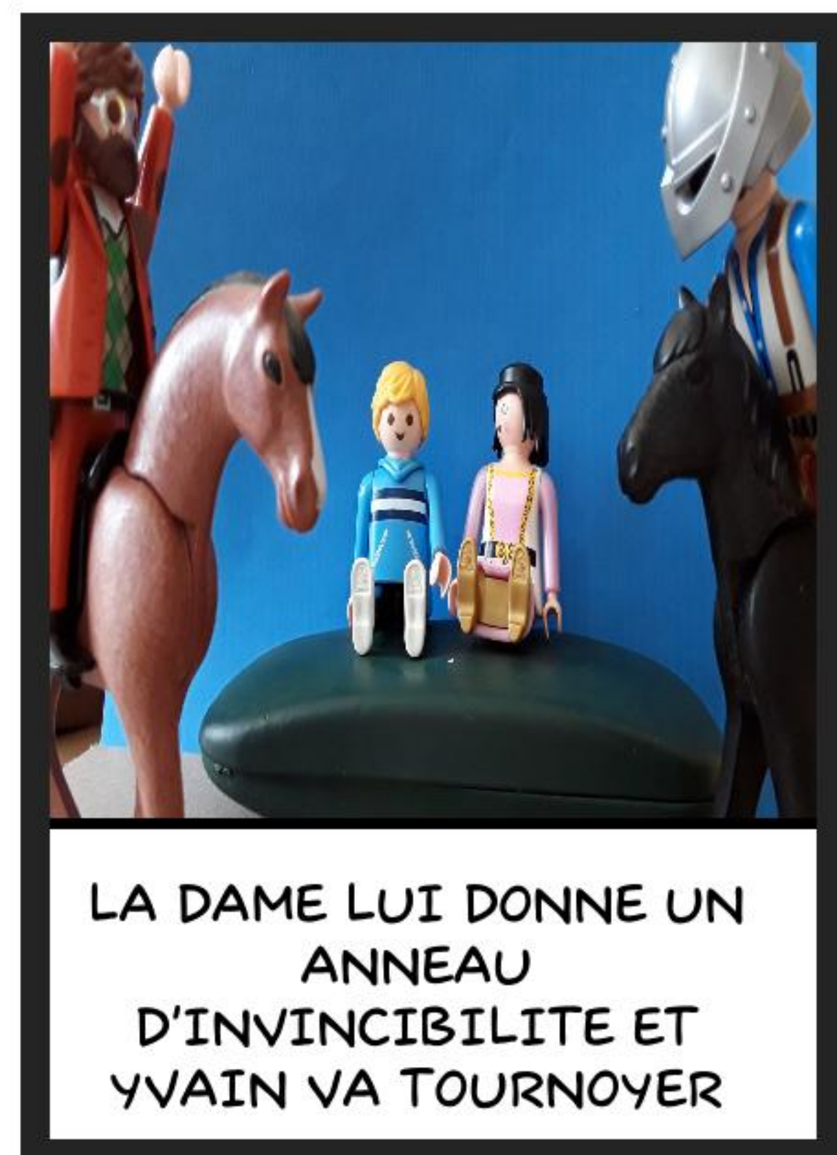
LA DAME LUI DONNE UN ANNEAU D'INVINCIBILITE ET YVAIN VA TOURNOYER