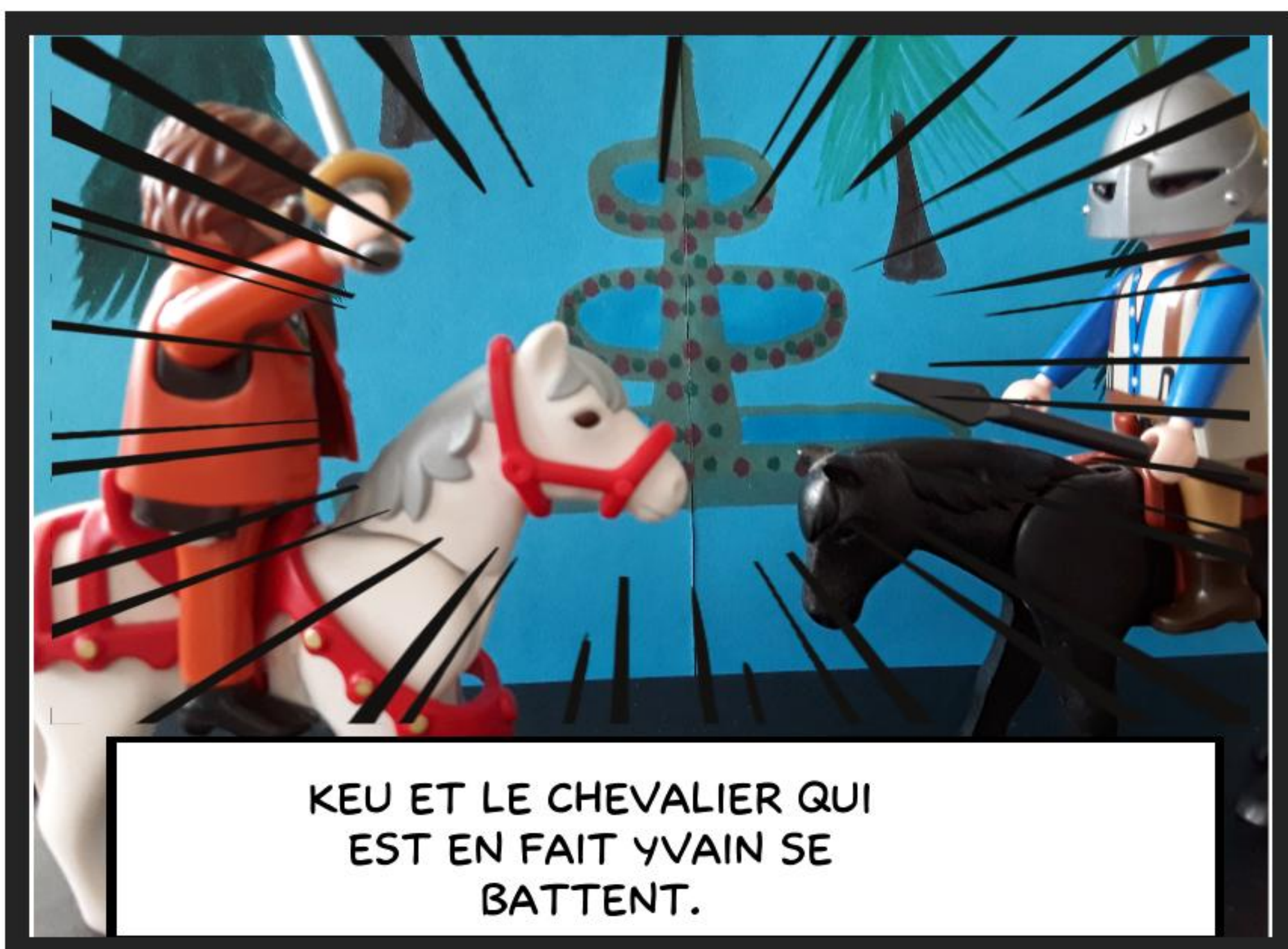
KEU ET LE CHEVALIER QUI EST EN FAIT YVAIN SE BATTENT.

SEIGNEUR LAISSEZ MOI ME BATTRE CONTRE LUI S'IL VOUS PLAÏT.