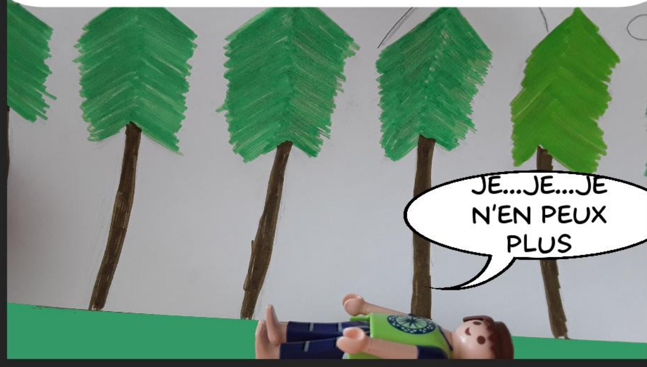
YVAIN EST DANS UN PITEUX ÉTAT