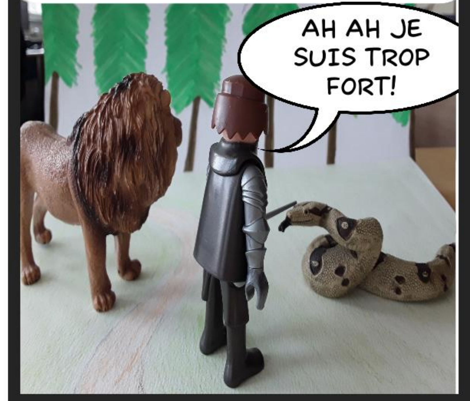
YVAIN TUE LE SERPENT ET SAUVE LE LION