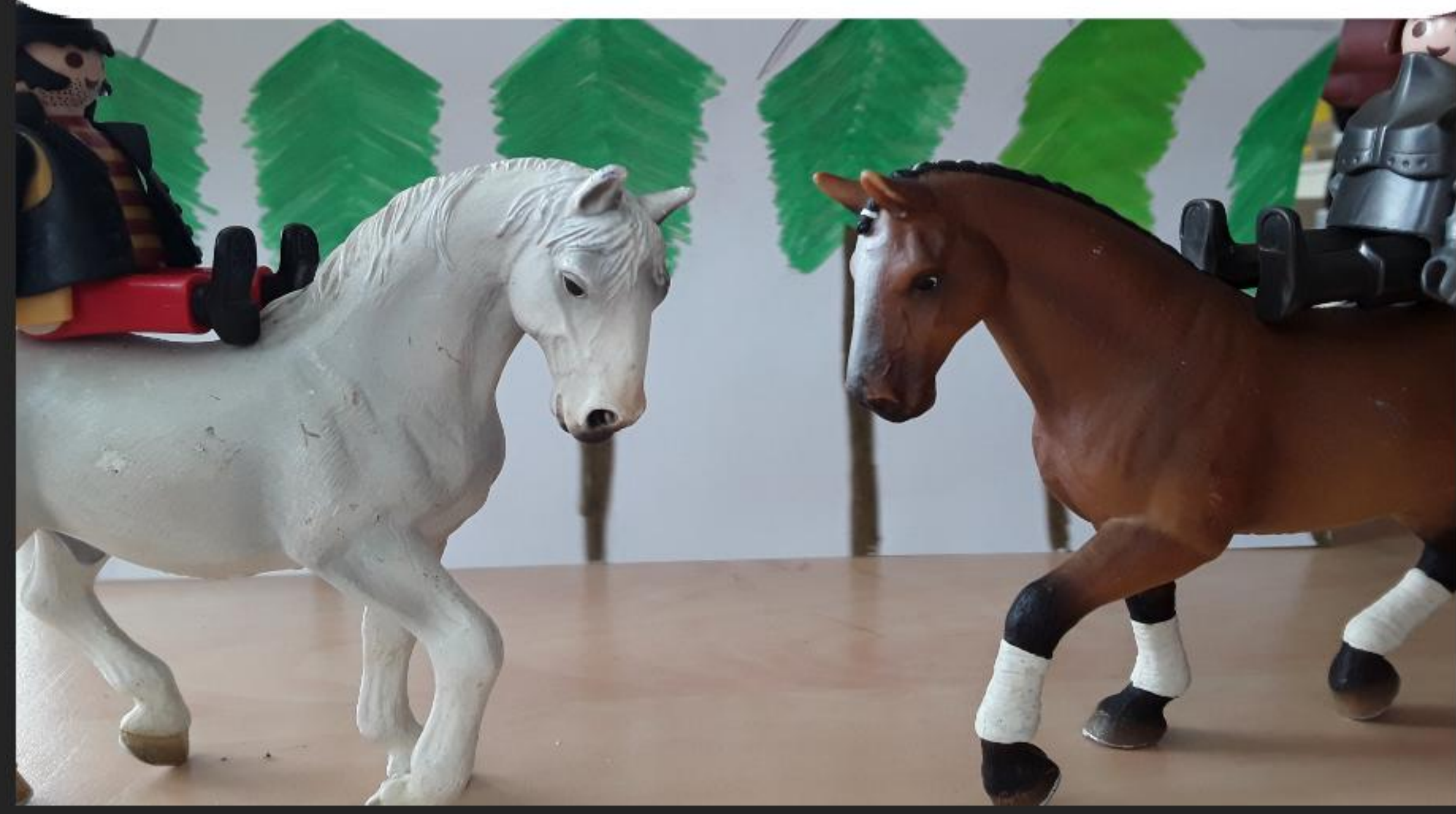
YVAIN SE BAT CONTRE LE COMTE ALIER