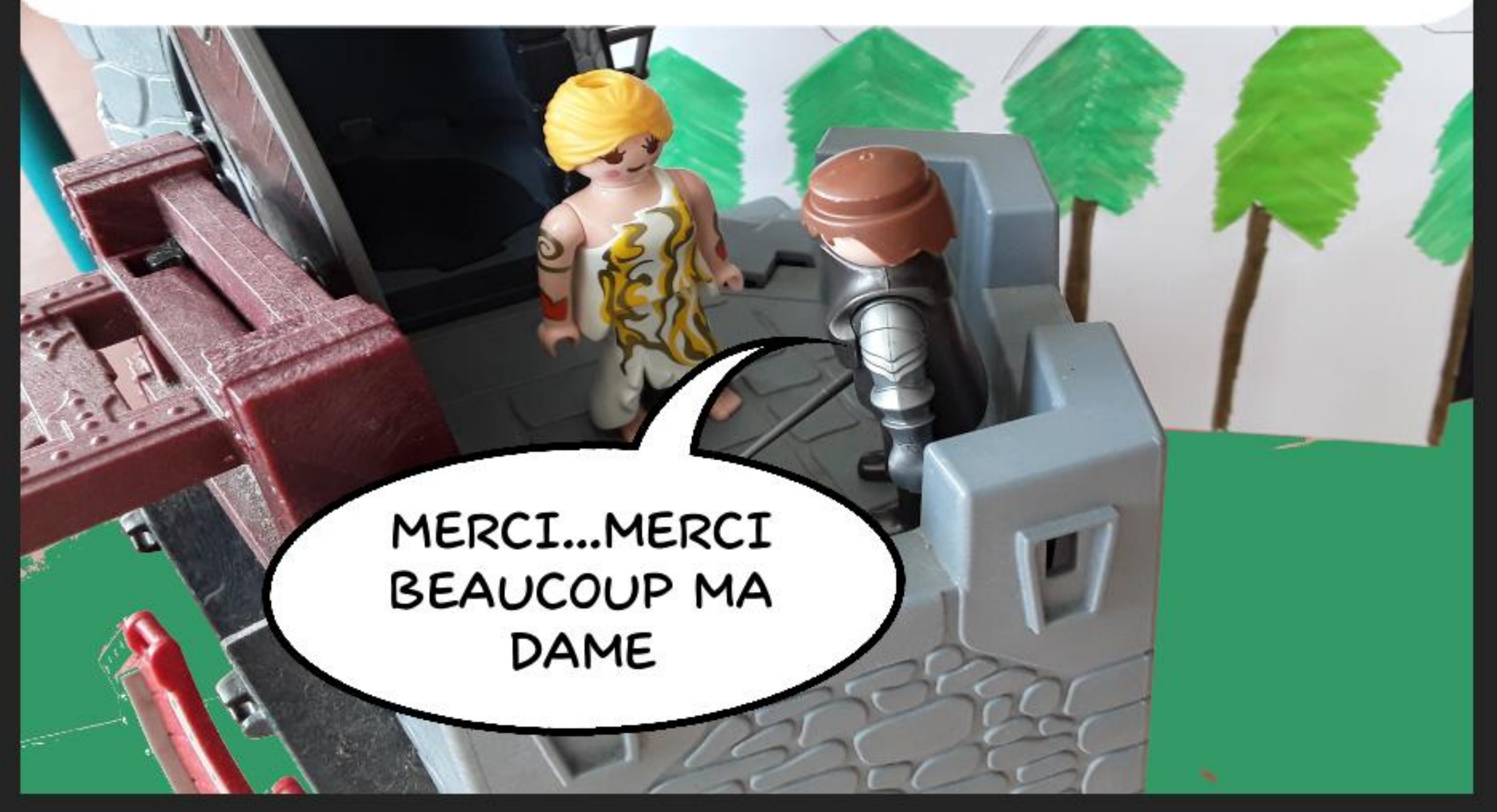
LA FEMME PARDONNE À YVAIN