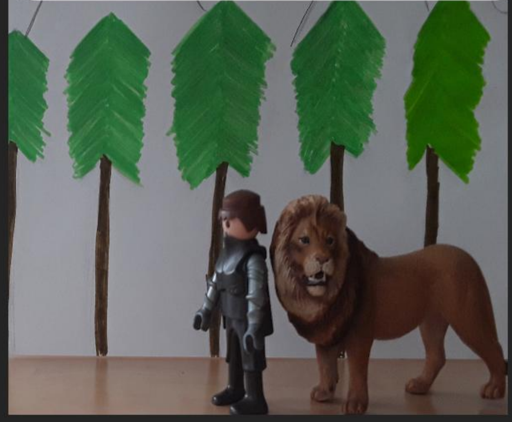
YVAIN ET LE LION PARTENT ENSEMBLE