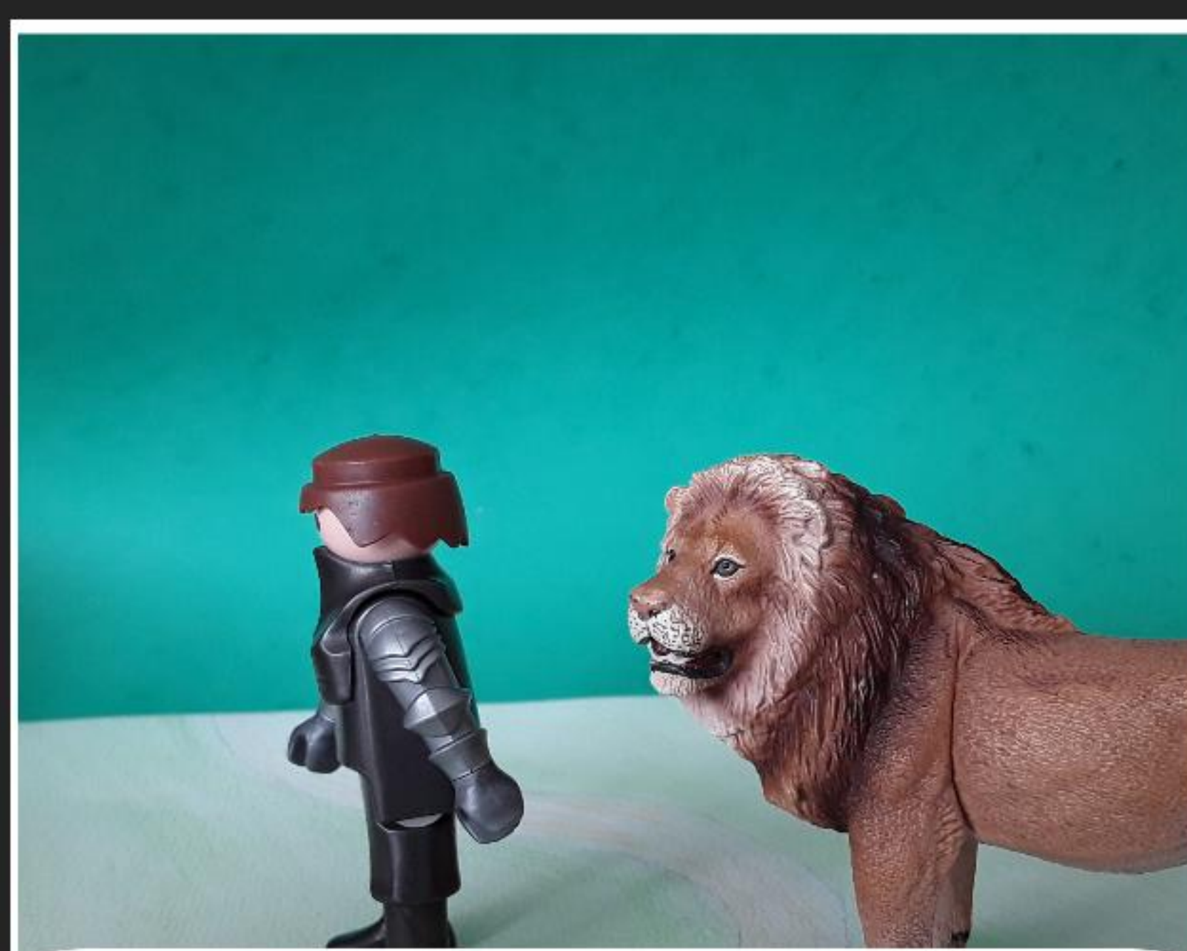
YVAIN ET LE LION MARCHENT ENSEMBLE PENDANT 15 JOURS