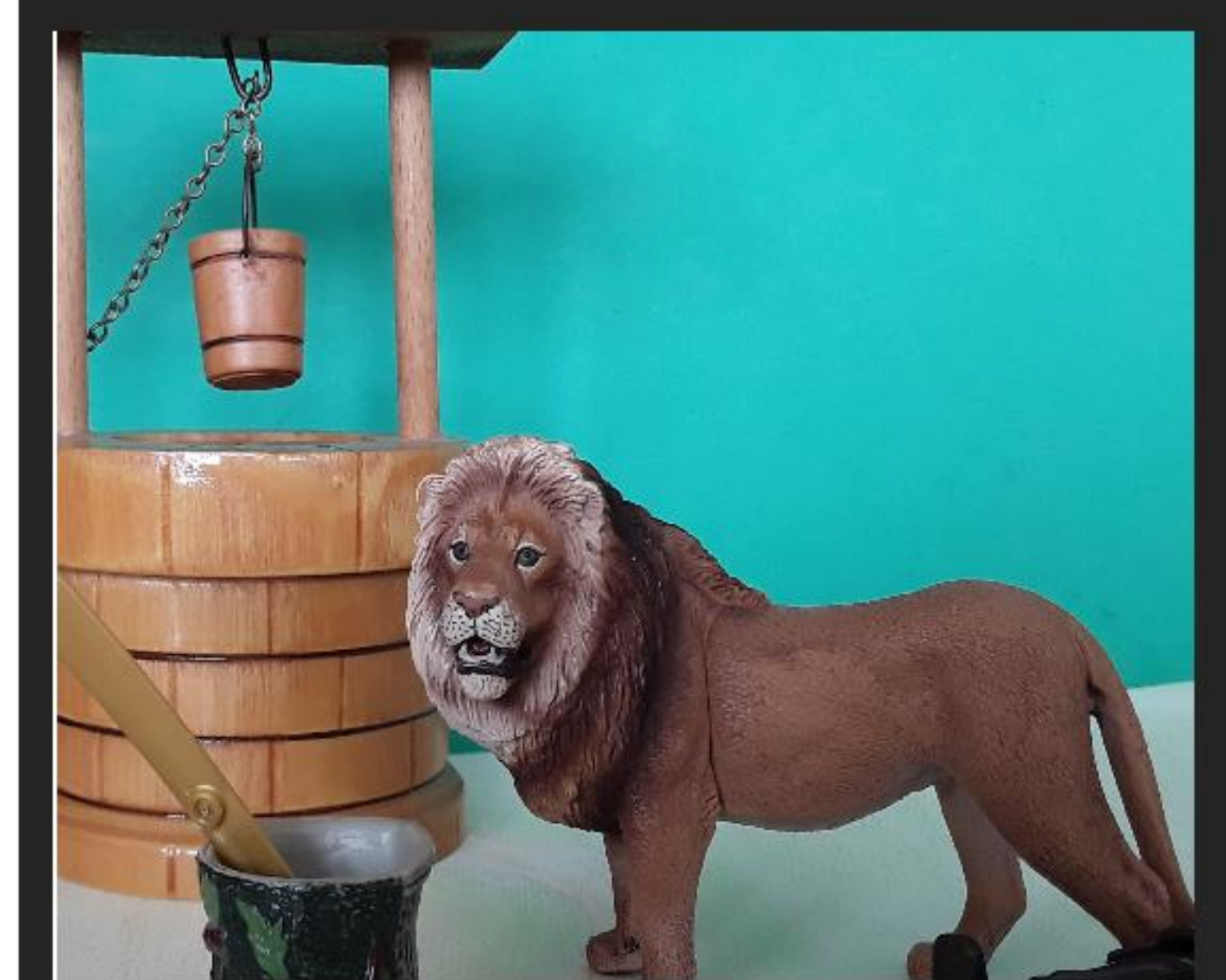
YVAIN SE RÉVEILLE ET VOIT LE LION PRET A SE SUICIDER