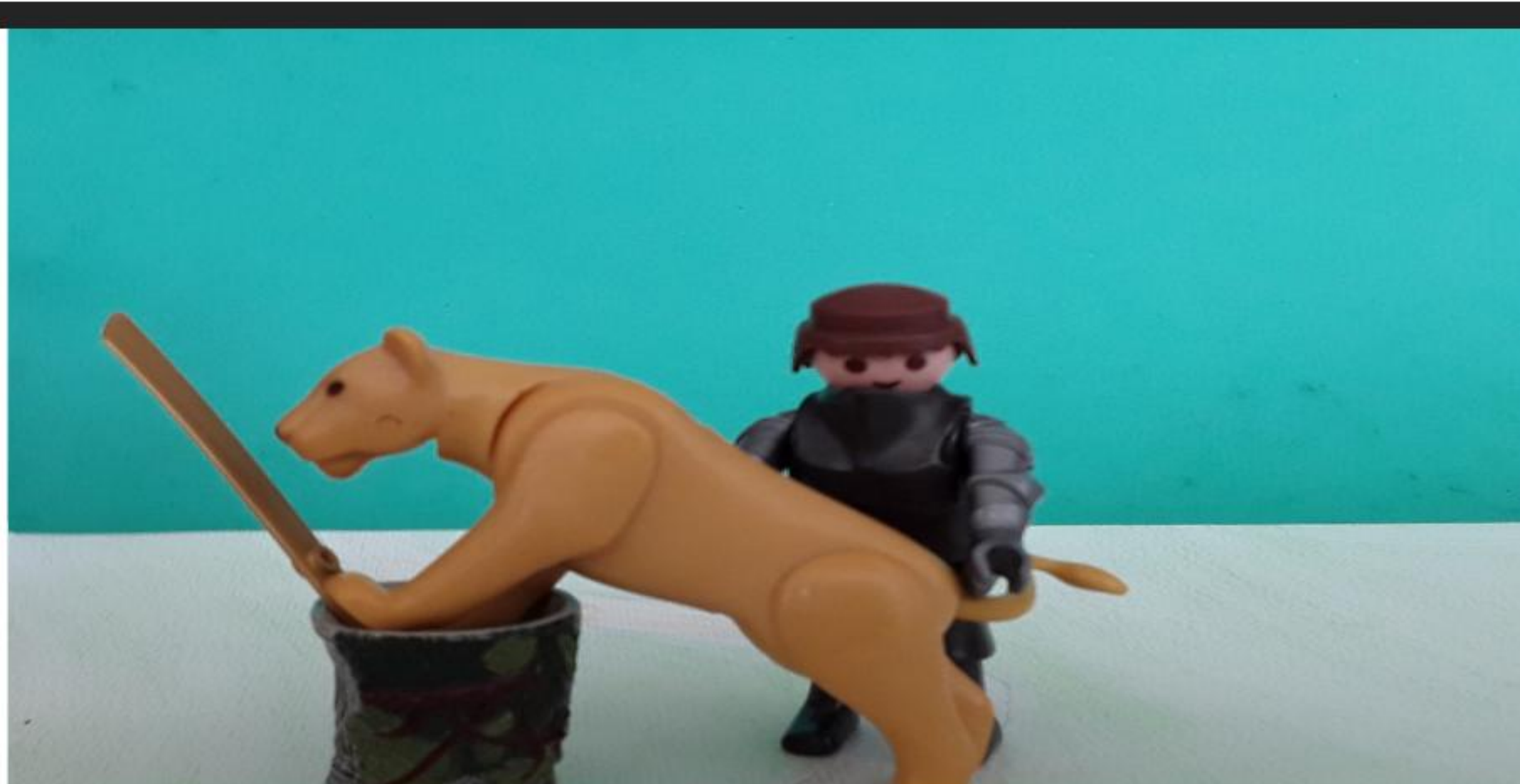
YVAIN RETIENT LE LION