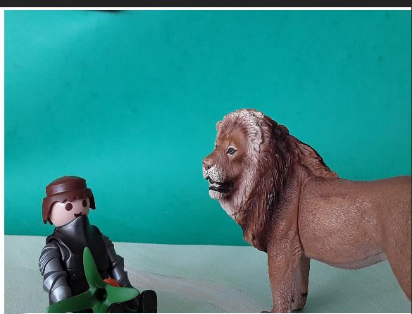
YVAIN ET LE LION PRENNENT UN REPAS ENSEMBLE