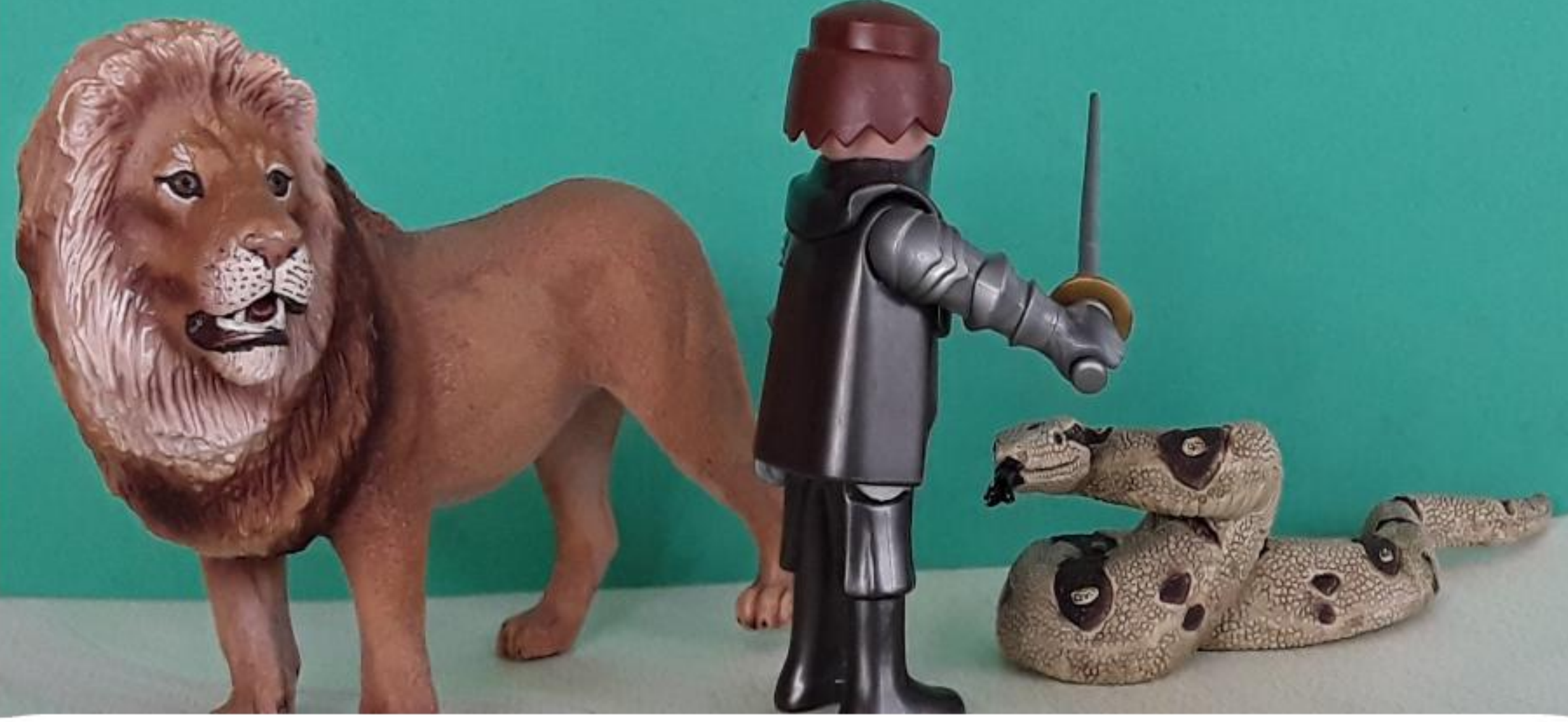
YVAIN TUE LE SERPENT QUI VOULAIT TUER LE LION.