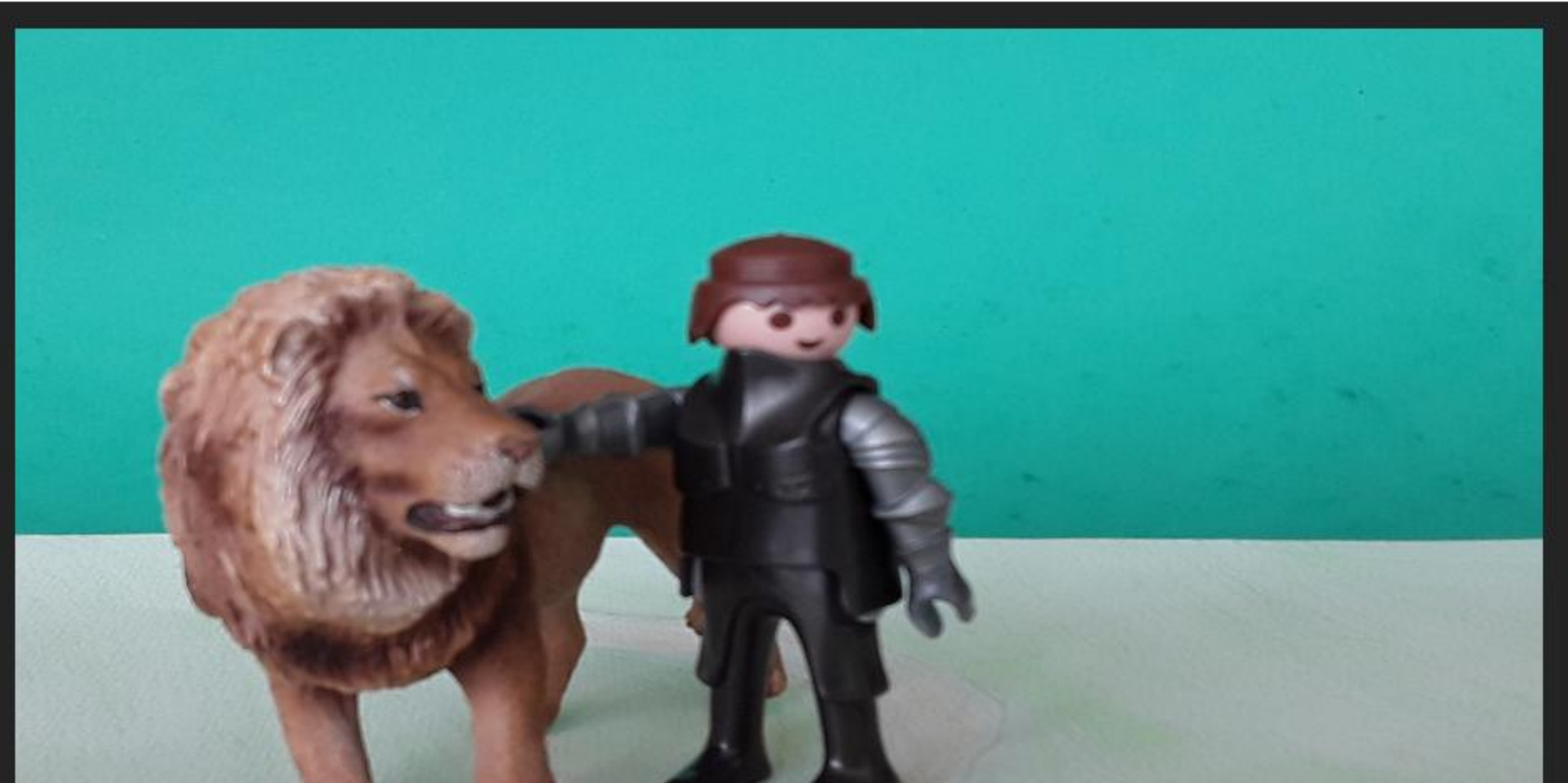
YVAIN PENSE AU LION ET A SA DAME