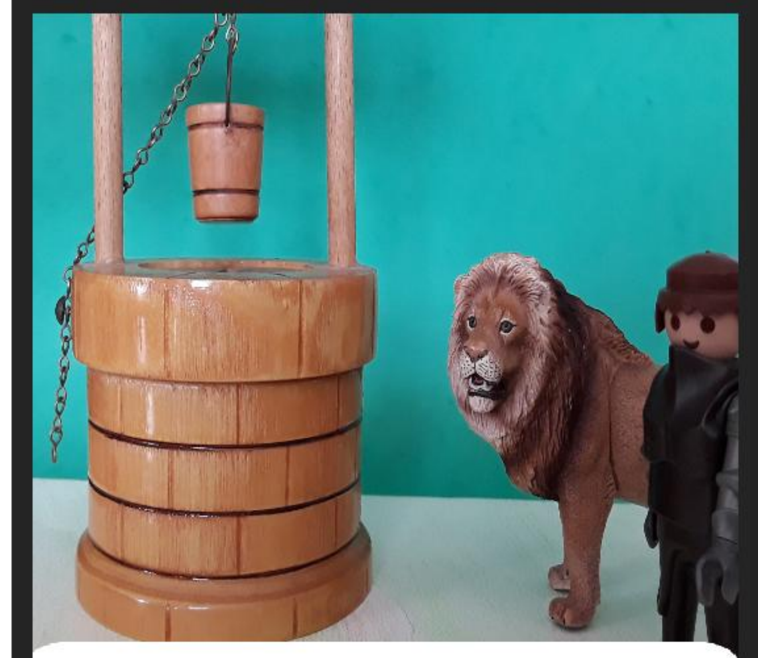
LES COMPAGNONS ARRIVENT PAR HASARD À LA FONTAINE