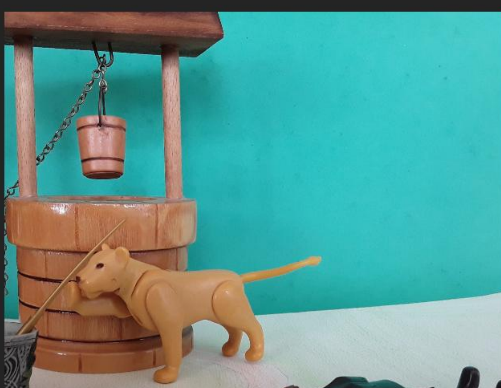
LE LION PENSANT QUE SON MAITRE EST MORT, PRÉPARE UNE ÉPÉE POUR SE DONNER LA MORT.