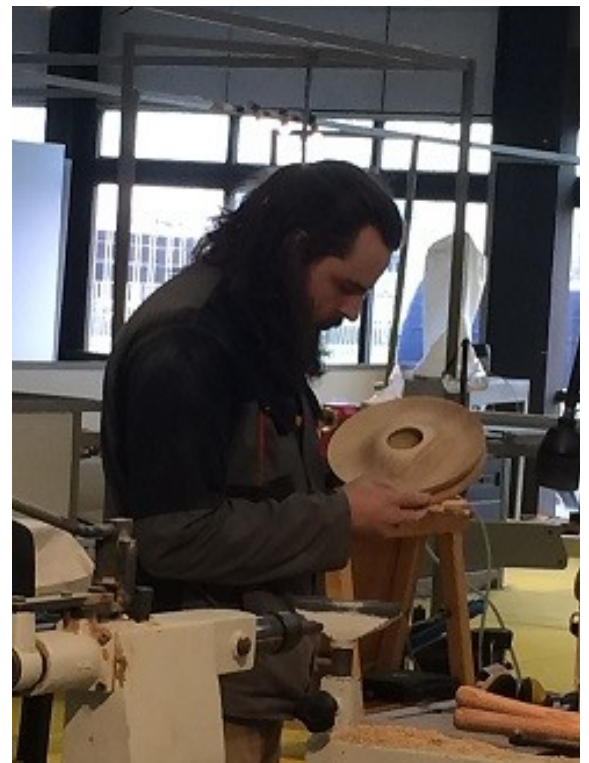
Le tourneur sur bois