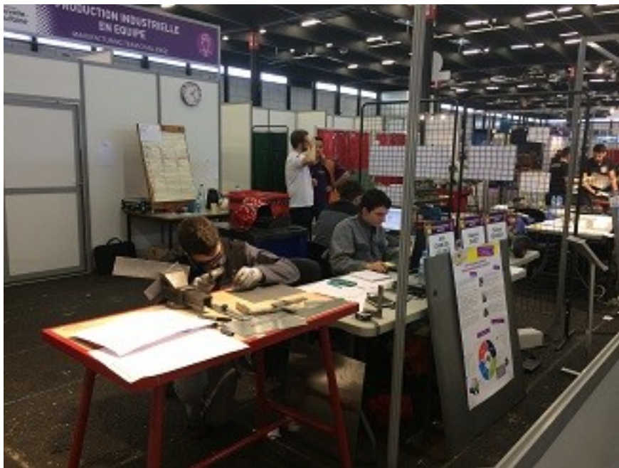
L'atelier de production industrielle en équipe