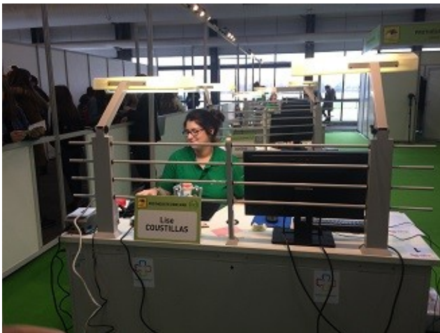
La prothésiste dentaire