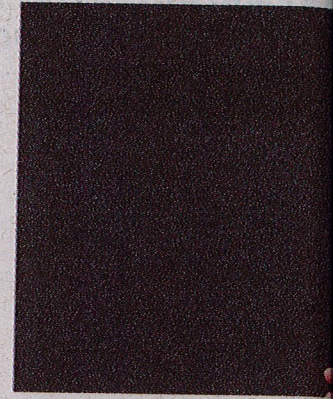
Nicolas Devort seul en scène dans ce spectacle.

Vendredi 15 mars à 20 h 30. Tarifs : 17 € / 14 € / 10 €. Billetterie et réservation : 05 46 36 32 77 ou sur place 30 minutes avant le concert.