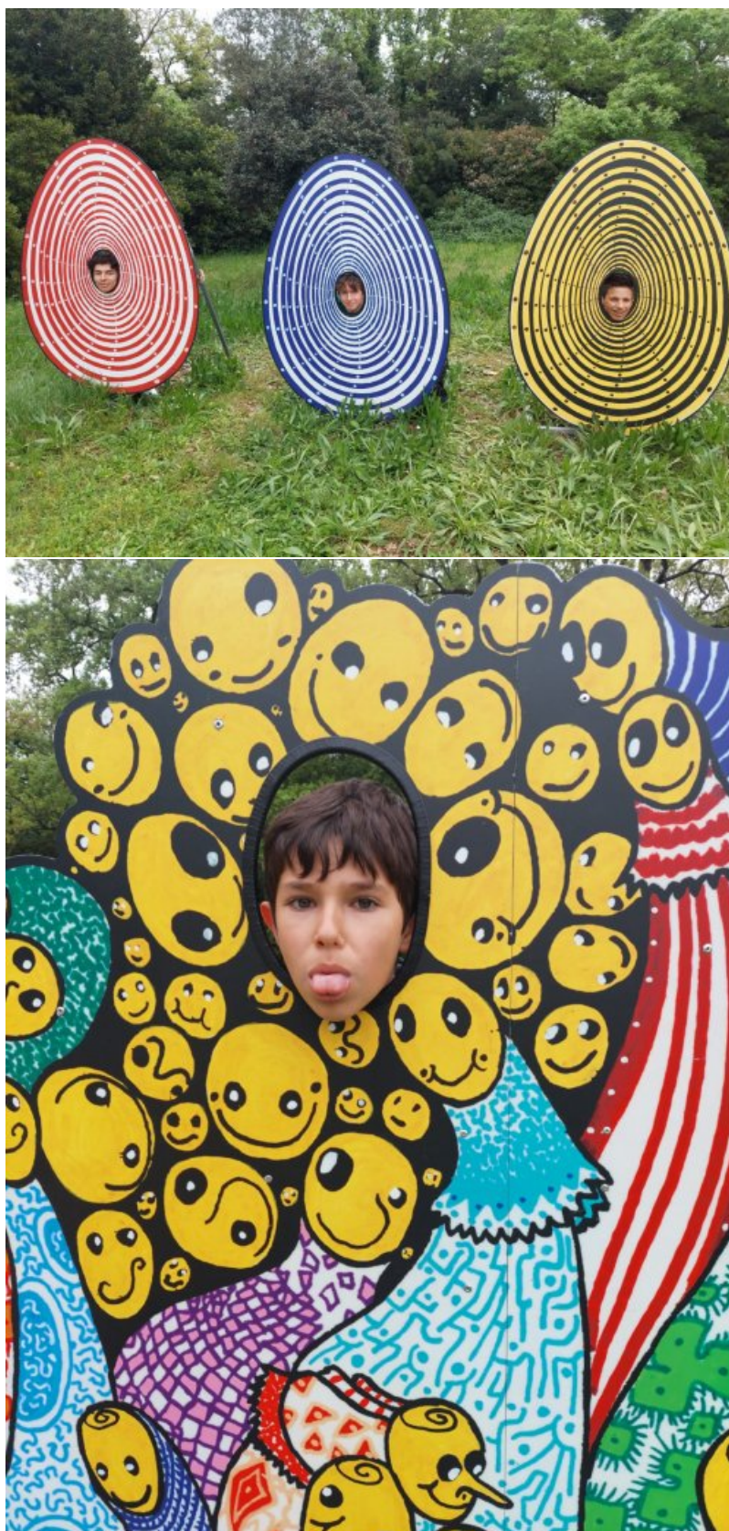
Demain : direction Arelate ! (Arles)