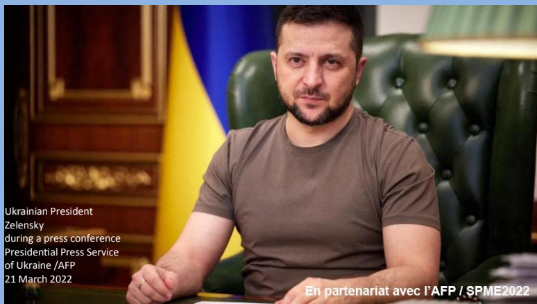
Ukrainian President Zelensky during a press conference 21 March 2022

Volodymyr Zelensky ready to deal with Vladimir Putin Dombass and Crimea After 27 days of Russian invasion in Ukraine, big cities like Marioupol and Kyiv still endure Vladimir Putin's army. The Ukrainian president is ready to deal Dombass and Crimea.