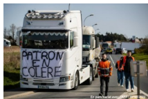
Truck drivers are very angry after the rise of the fuel prices 22 march 2022

The road fuel price in France. French service stations lowered the fuel road price below 2 euros on average. Page 4