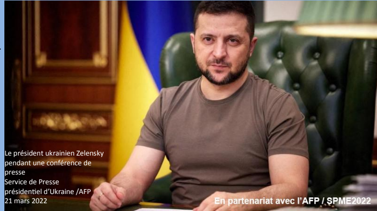
Le président ukrainien Zelensky pendant une conférence de presse 21 mars 2022

Au 27 e jour de l'invasion des forces Russe en Ukraine, des grandes villes comme Marioupol et Kyiv, subissent encore les assauts de l'armée de Vladimir Poutine.