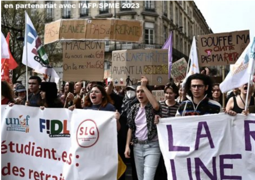
Des étudiants manifestent contre la réforme des retraites à Bordeaux

Collège André Albert, 2 Rue Jules Ravet, 17600 Saujon