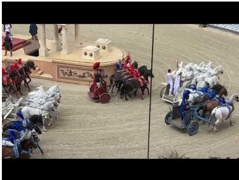
Paris 2024 : la Flamme olympique au Puy du Fou - 4 juin 2024 (Video Youtube)

Un grand merci à Pierre et Antoine pour leur disponibilité. Ils nous ont donné encore plus envie d'y être !!!!