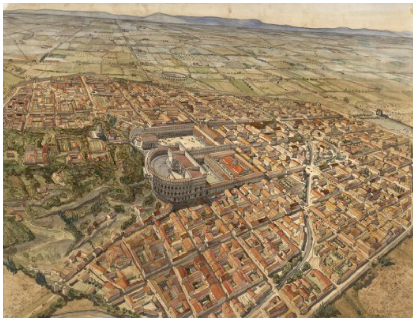
Arausio (Orange) par JC. Golvin