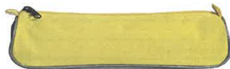
Trousse coloris aléatoire

Nota : Sur notre liste, il manque quelques fournitures par rapport à la liste donnée par le Collège. Cela est volontaire car le Département a fait le choix cette année encore d'accompagner les élèves et leur famille en leur offrant quelques fournitures (crayon 4 couleurs, feuilles simples et doubles, pochettes plastiques, kit géométrie, clé USB, classeur souple et écouteurs filaires)