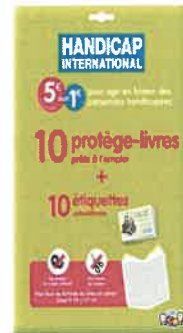
t de 10 protégé-livre