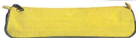
Trousse coloris aléatoire