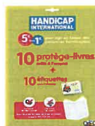
Kit 10 protège-livre