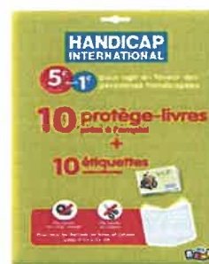
Kit 10 protège-livre