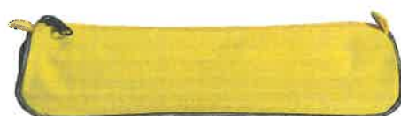
Trousse coloris aléatoire