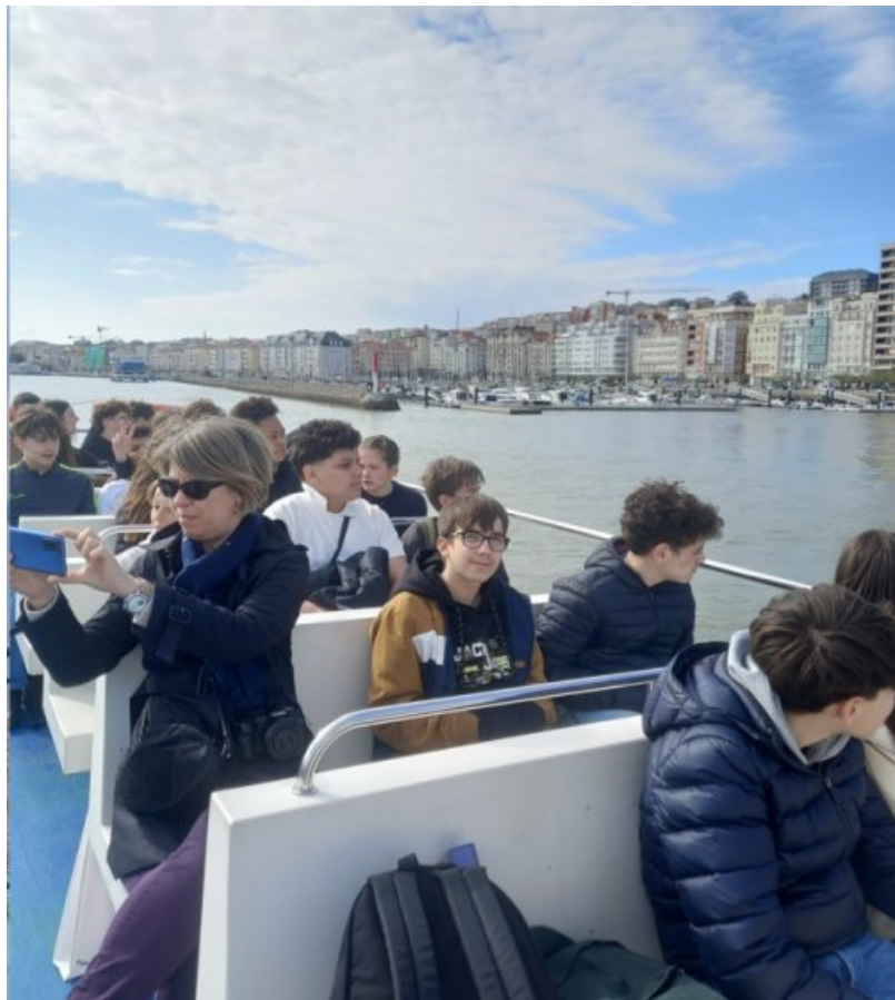
Jeu de piste dans la presqu'île de la Magdalena