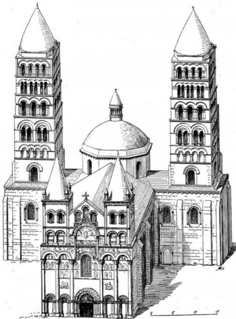
6. ANGOULESME (W).

Voici le fruit de leur travail de recherches et d'écriture : « Meurtre à la Cathédrale d'Angoulême ! »