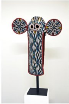
Masque Cagoule "Éléphant", Bamiléké, Cameroun, 1930-1950