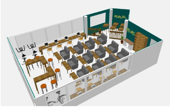
Repenser l'utilisation des locaux pour favoriser l'autonomie et l'implication des élèves / Mercredi 31 mars 2021 / Koch Theibault principal collège Pierre Badet