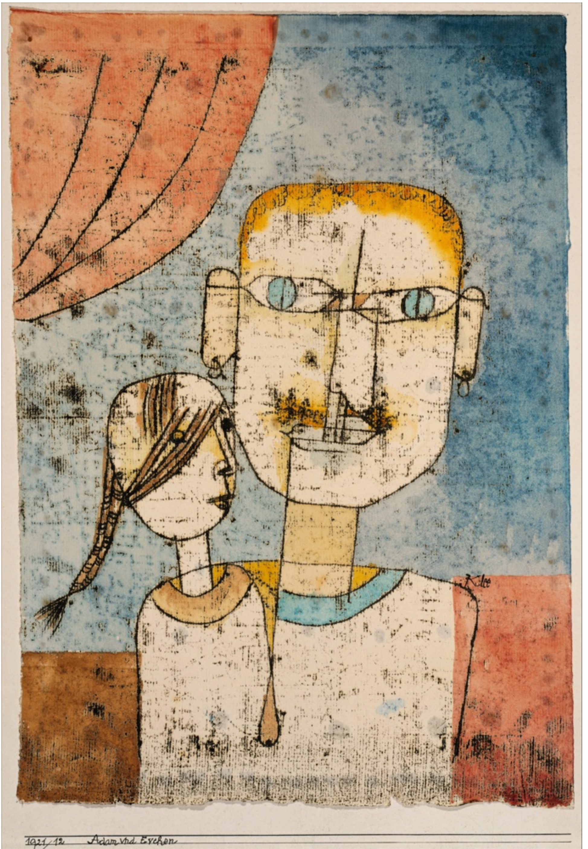
Adam et la petite Eve , 1921, Paul Klee, The Metropolitan Museum of Art, New York