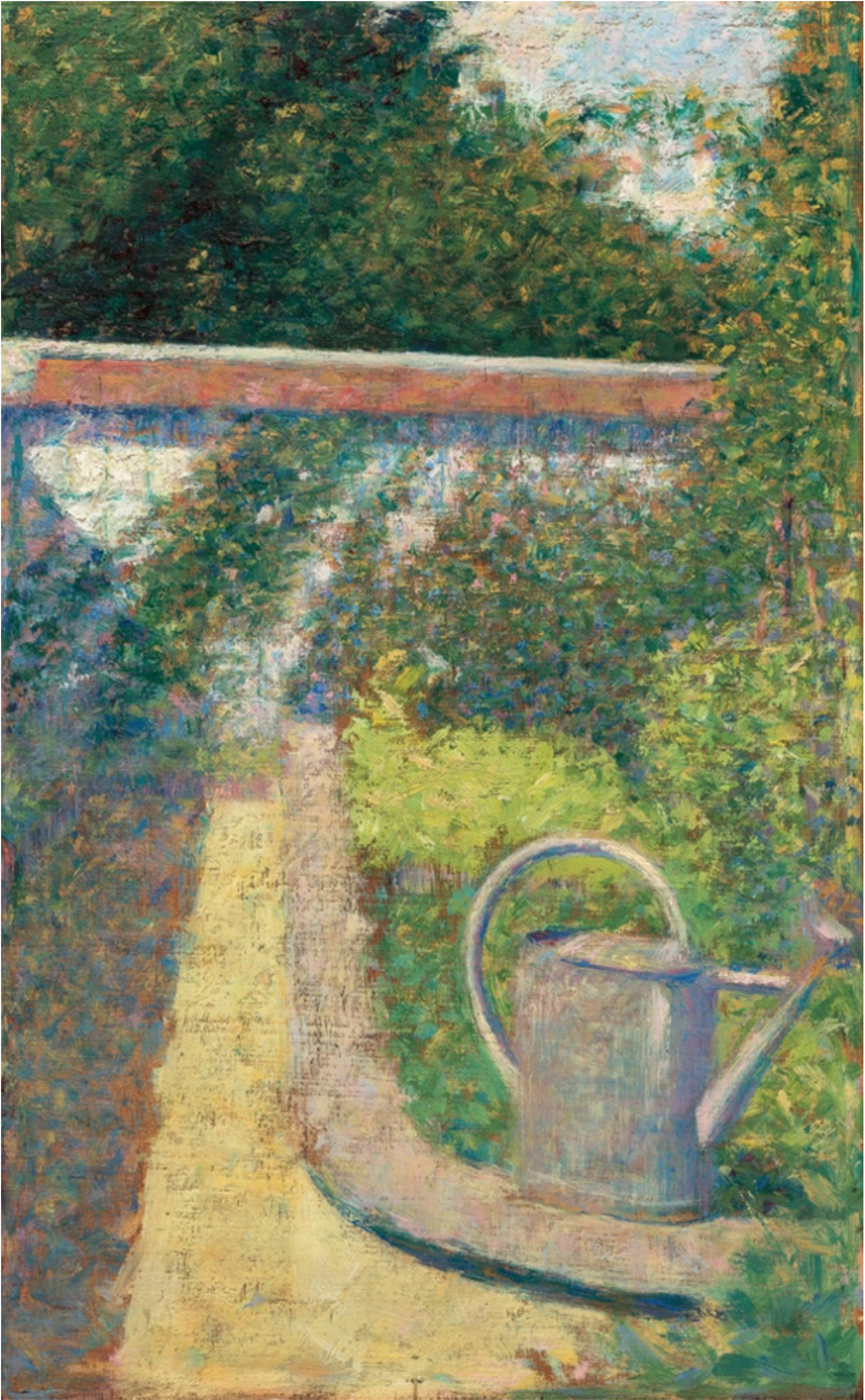
L'arrosoir , vers 1883, Georges Seurat, National Gallery of Art, Washington