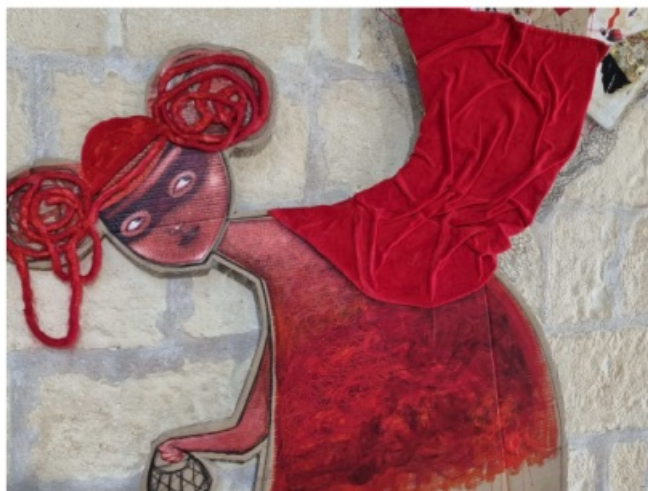
( détail de l'exposition « Trace » de Madalina Dina à la halle aux poissons, Marans, avril 2024 )