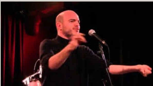
Vidéo de Maras

La ville était complètement déserte. Les rues se dépeignaient comme des dédales abandonnés. Il y avait des maisons étranges aux couleurs écarlates. Je me suis approchée de ces habitations éclairées. Par la fenêtre, il y avait quelqu'un... d'heureux ? Il paraissait n'avoir besoin de rien. Il était avec sa Chose Spéciale, si serein. J'ai regardé dans les autres maisons, que des personnes heureuses. Les gens s'amuse avec leur Chose plus qu'avec les autres gens. Et donc, c'est la raison pour laquelle plus personne ne sort. Je vais partir vers une autre ville, trouver MA chose spéciale. Et j'aimerais que quelqu'un me trouve. Une personne rien que pour moi. Sthéfica G.