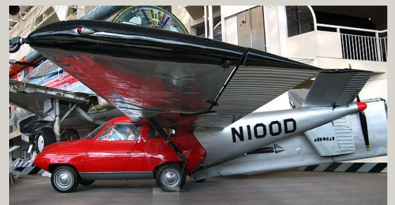
Vidéo de la voiture volante

La voiture du futur pourrait avoir des ailes puis les détacher pour rouler comme une voiture normale.