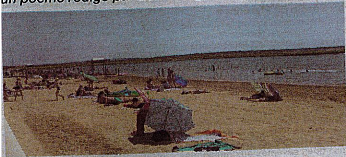
La plage de Marennes attire chaque été de nombreux estivants.

Cet été, le "Littoral" publie chaque semaine un poème rédigé par des collégiens marennais.