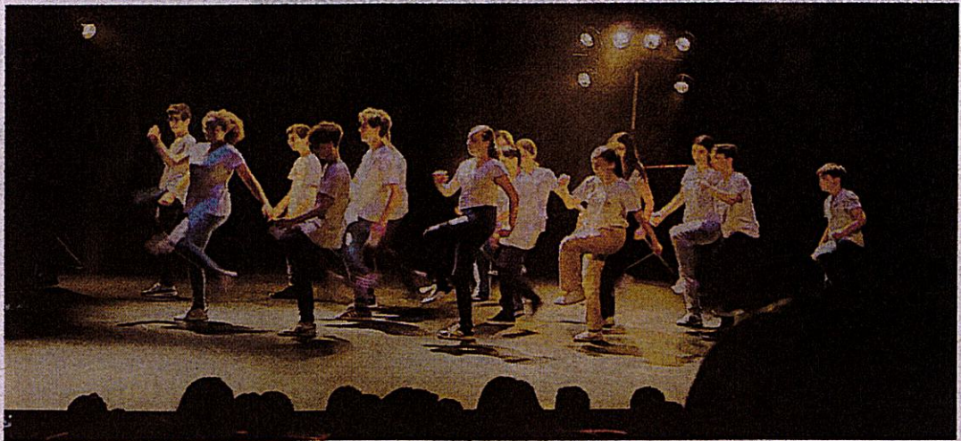
La chorégraphie hip-hop a déchaîné la foule.

L'année scolaire se termine tout feu tout slam au collège Jean-Hay.