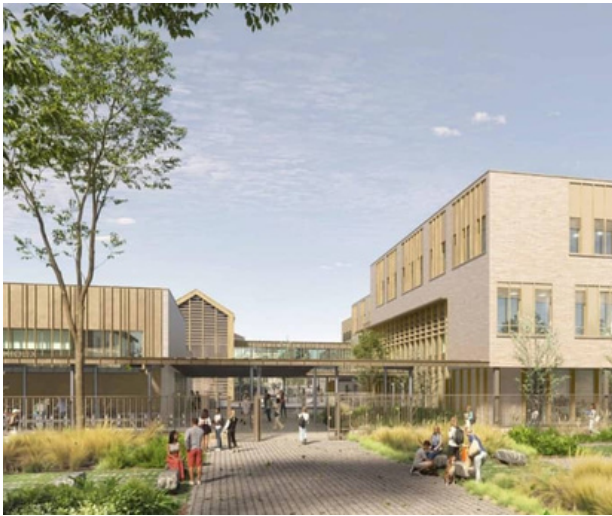
Premières images du nouveau collège

Le collège le Marchioux, construit en 1835 à Parthenay, a pour projet de se réunir avec un autre collège, mais lequel ?