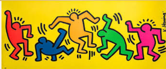
Keith Haring's style

Ils ont d'abord découvert l'univers coloré et dynamique de Keith Haring, avant de réaliser leurs propres créations inspirées de son style. Vous trouverez ci-dessous leurs œuvres réalisées dans le cadre de leur mini-tâche : Design a Living Haring Painting .