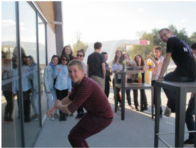
Pause goûter, pause toilettes.