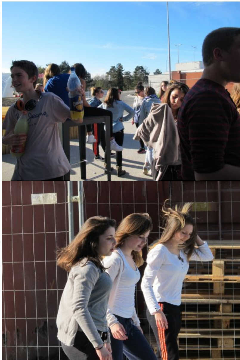
Un spectacle de danse gratuit pendant l'escale goûter avec de belles jeunes filles