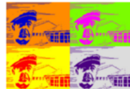
Collège Jacques PRÉVERT - MONCOUTANT