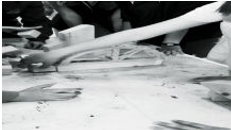
Atelier architecture romane musée d'Angoulême (Vidéo PeerTube)

Puis, après une visite rapide de la cathédrale d'Angoulême, nous sommes allés faire une longue pause pique nique dans le jardin vert.