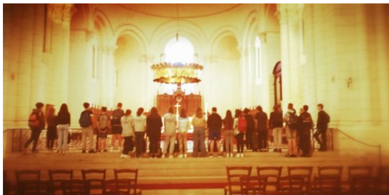
Photo de classe

Puis, après une visite rapide de la cathédrale d'Angoulême, nous sommes allés faire une longue pause pique nique dans le jardin vert.