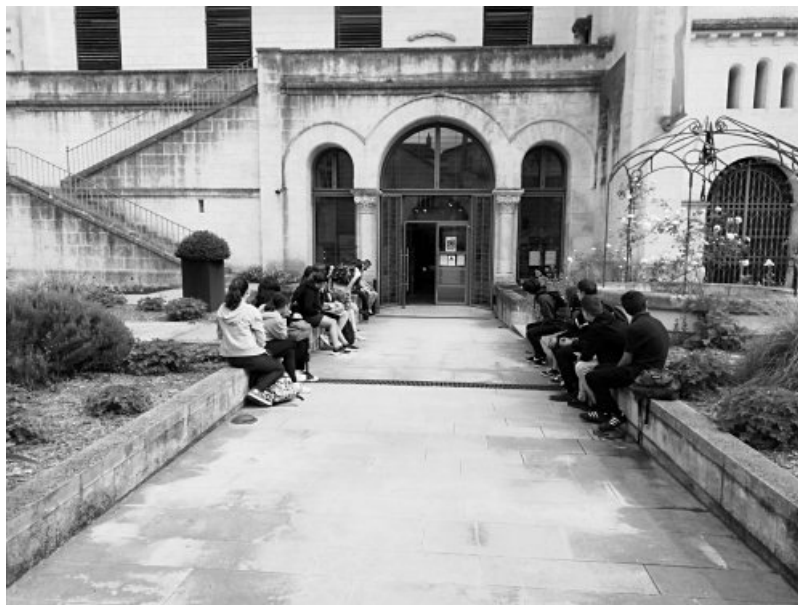
Devant le musée

La journée a commencé par la visite du musée d'Angoulême.