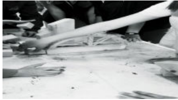
Atelier architecture romane musée d'Angoulême (Vidéo PeerTube)

Puis, après une visite rapide de la cathédrale d'Angoulême, nous sommes allés faire une longue pause pique nique dans le jardin vert.