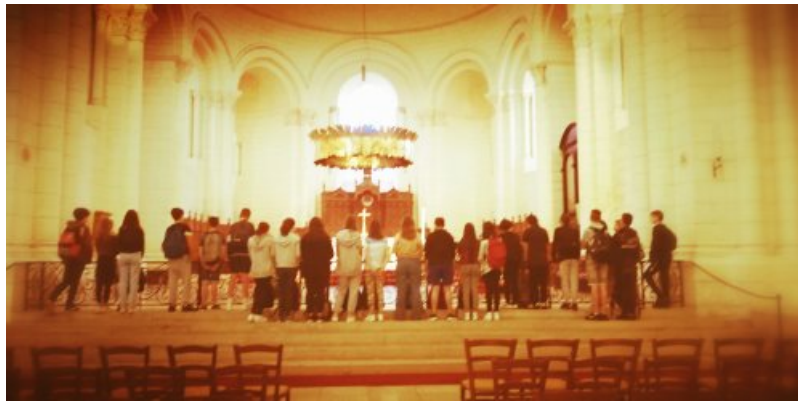
Photo de classe

Puis, après une visite rapide de la cathédrale d'Angoulême, nous sommes allés faire une longue pause pique nique dans le jardin vert.