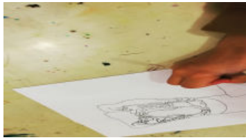
Atelier Musée Dessins chapiteaux (Vidéo PeerTube)