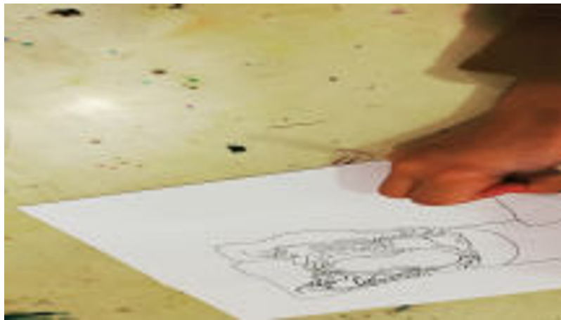
Atelier Musée Dessins chapiteaux (Vidéo PeerTube)