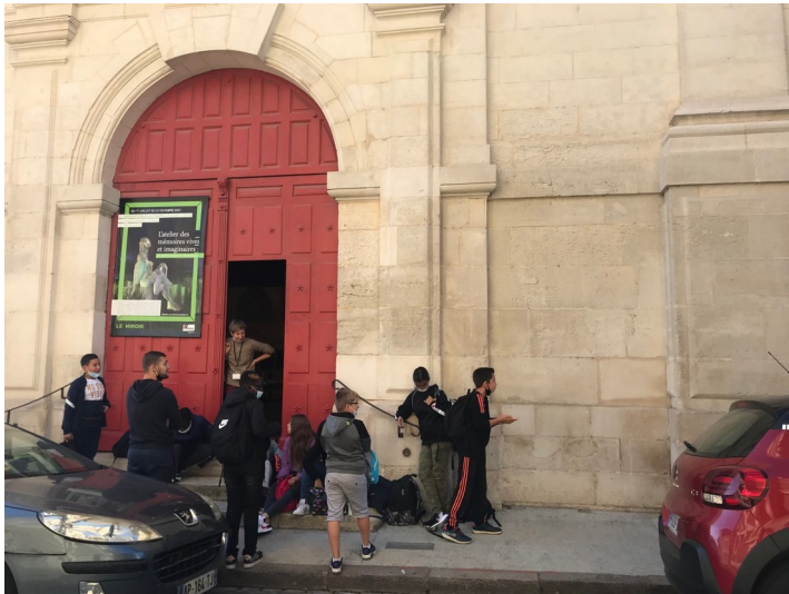
Les élèves impatients d'entrer!