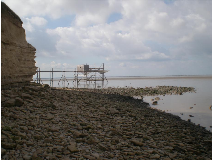
Un carrelet situé près de la plage