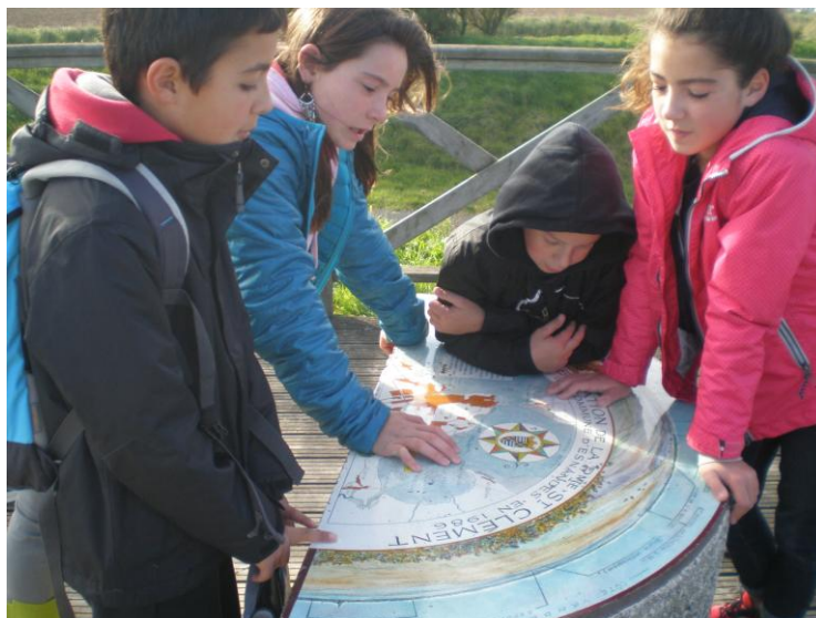
À la recherche des villages autour de la baie de l'Aiguillon Sur Mer...