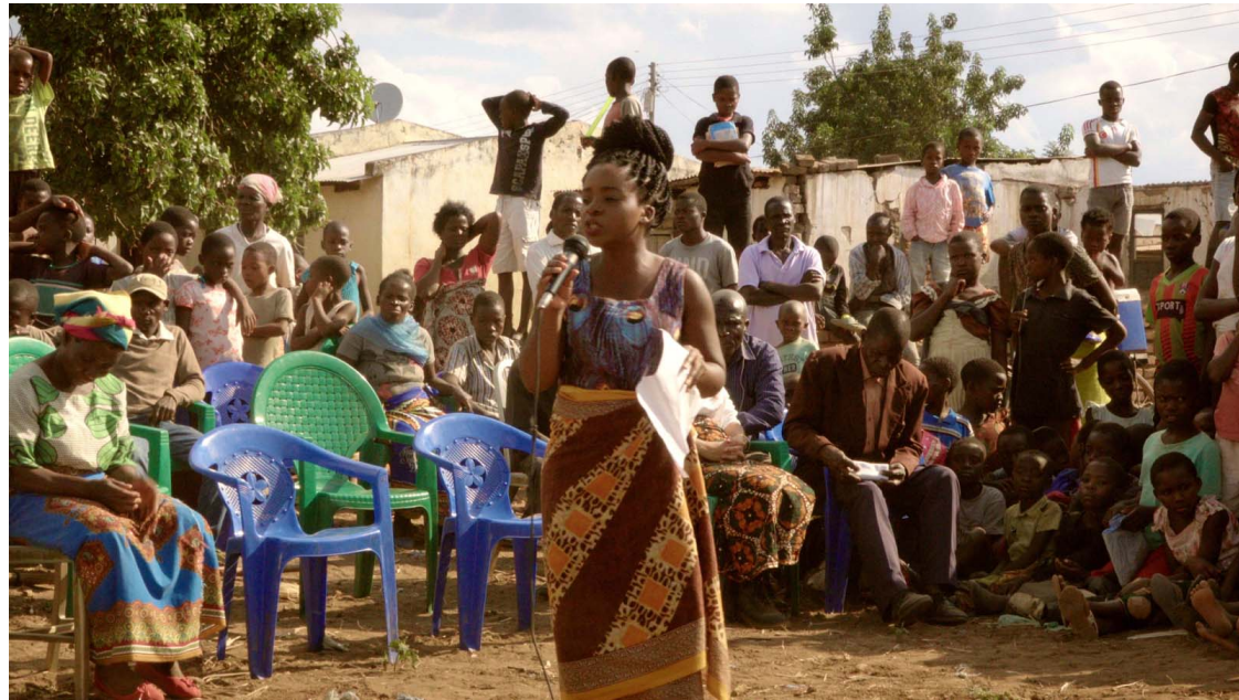
Photo d'un discours de Mémory Banda

On aime son engagement car on ne trouve pas très juste d'utiliser les femmes comme de vulgaires objets.