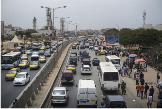
Circulation routière à Dakar, Sénégal. NICOLAS LEBLANC

-tendre que les poussières partent. Depuis 3 ans la pollution est devenue un cauchemar car elle augmente de plus en plus. Cette ville est devenue irrespirable. Les asthmatiques