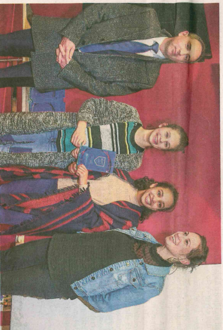
La section sportive de patinage artistique du collège Jean-Zay a reçu un trophée pour sa troisième place en championnat de France UNSS.