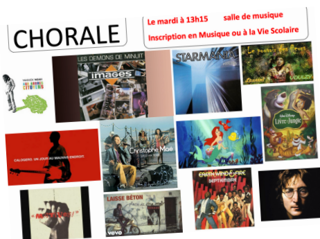
Un petit aperçu de la programmation du futur concert

Ce projet, pour lequel un investissement sur l'année est indispensable, permet aux élèves de développer leur technique vocale, mais également de découvrir les métiers autour du spectacle (techniciens son et lumière, musiciens, gestion de la salle et du public ...). Développant l'estime de soi, l'altruisme, la concentration, la mémorisation et la rigueur, la chorale est un facteur de réussite scolaire.