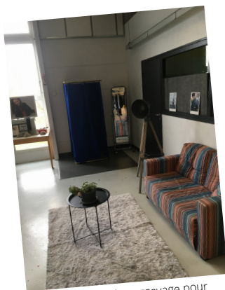
Espace accueil et essayage pour les clients de la boutique solidaire