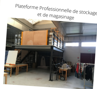
Plateforme Professionnelle de stockage et de magasinage

Cet atelier gère la boutique solidaire et organise des événements au sein du collège. Le marché de Noël s'est par exemple déroulée avant les vacances. Cela permet à nos élèves de gérer de manière concrète un espace de vente et de travailler sur les compétences liées à ces métiers.