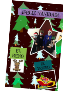
Travail en espagnol dans le cadre d'un échange avec les correspondants