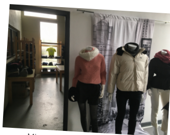
Mise en valeur des vêtements de la boutique