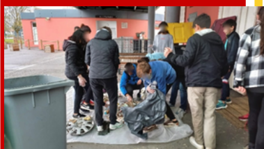
Le retour des élèves ayant nettoyé l'après course !

Stationnement et circulation interdits entre 8h00 et 14h30