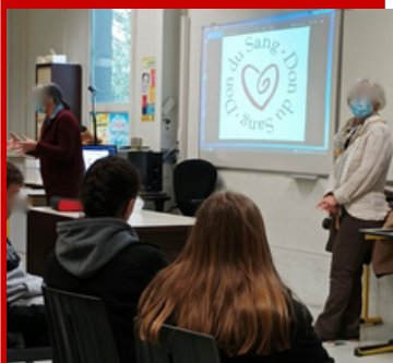
Les intervenants du don du sang