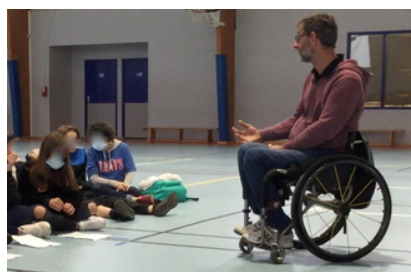
L'intervention des handisports !