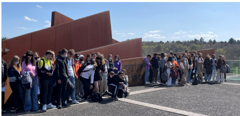
A l'entrée du centre de la mémoire

Les habitants ont été rassemblés sur le champ de foire où les hommes sont séparés des femmes et des enfants qui sont conduits dans l'église. Les hommes sont répartis dans des lieux clos repérés préalablement. Un signal est donné : ils sont alors simultanément exécutés. La troupe tue au hasard des rues et des habitations ; le village est pillé et incendié. Femmes et enfants sont massacrés dans l'église, que les soldats tentent de détruire avec des explosifs. Le lendemain, une section revient et incinère les corps par le feu et placent les cendres dans une fosse commune. Cet outrage aux cadavres rend impossible l'identification des morts, prolongeant la terreur jusque dans l'interdiction du deuil. Le massacre d'Oradour-sur-Glane a fait 643 victimes.