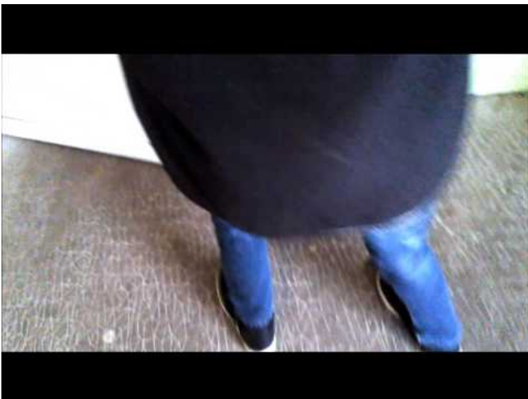
the wall (Video Youtube)