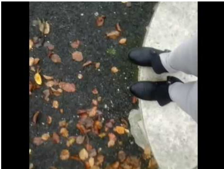
Les piéssoteurs (Video Youtube)