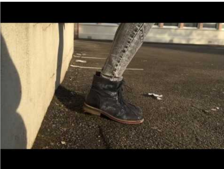
2A E (Video Youtube)