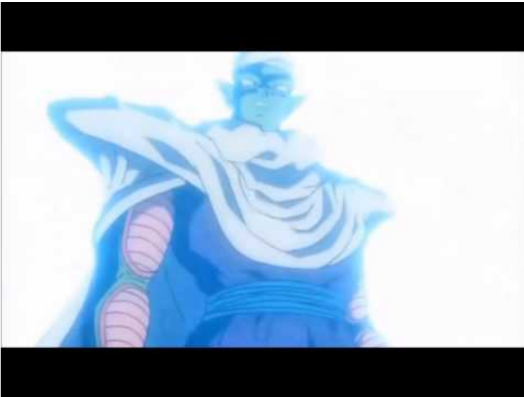
DragonBallShoes (Video Youtube)