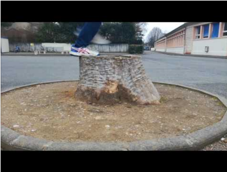
run (Video Youtube)