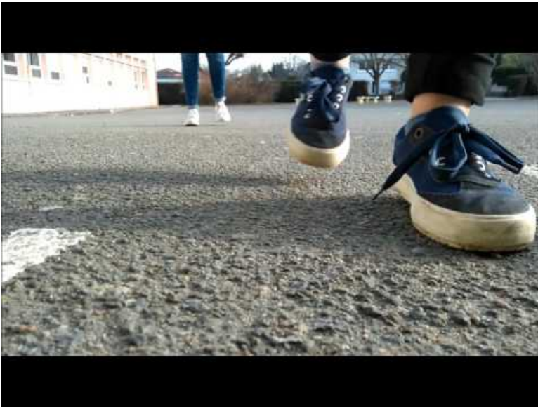
ACJ (Video Youtube)