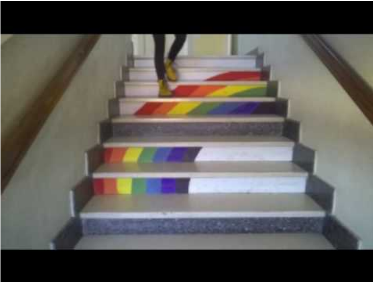
Les piedmontaises 2017 (Video Youtube)