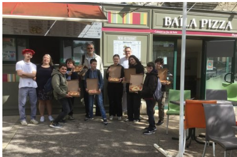
Nos 4èmes et leurs réalisations devant Baïla-Pizza