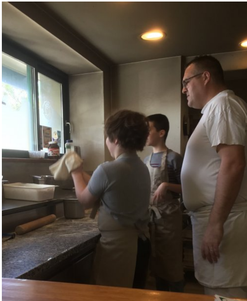
La technique du pizzaiolo, formation accélérée