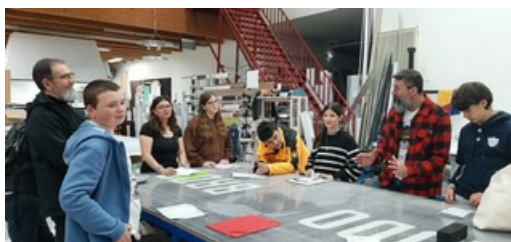
Nos 4èmes au Studio Ludo