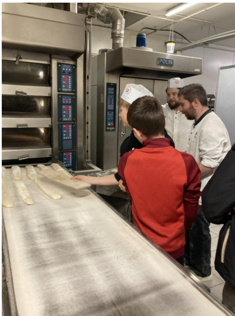
Chez Super U, formation "éclair" en boulangerie