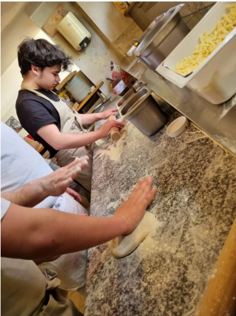
Préparation de la pate