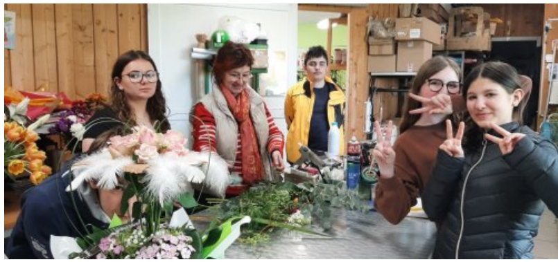
Nos 4èmes chez Vert tige