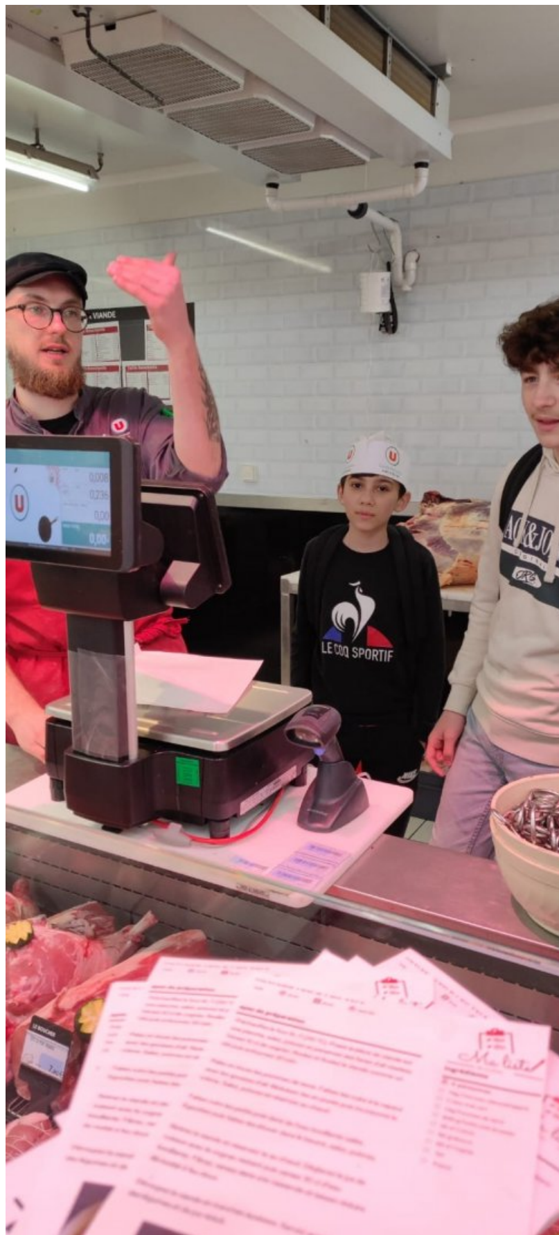
Nos 4èmes chez Super U