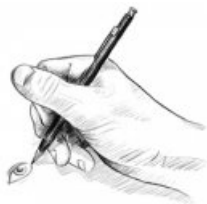
Illustration du futur carnet de correspondance