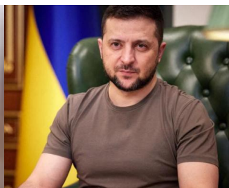
Le président ukrainien pendant une conférence de presse 21 mars 2022