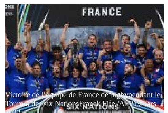
Victoire de l'équipe de France de rugby pendant le Tournoi des Six Nations France Eife /AFP 19 mars 2022 En avant vers la victoire... (suite page 15)