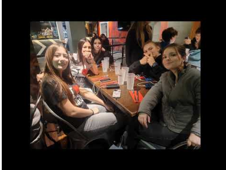
London Trip 2026 (Video Youtube)