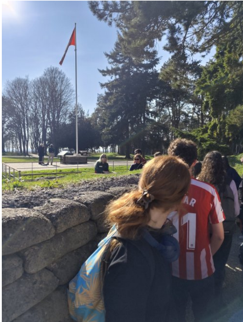
Voyage à Péronne, jour 3 Vendredi 28mars 2025

Dernier réveil à l'auberge, il est temps de faire les valises ! Direction Meaux pour la visite du musée de la Grande Guerre. Un lieu impressionnant et massif à l'intérieur duquel on trouve des expositions variées sur les thèmes du rôle des civils, des blessures et souffrances, des armes, des uniformes, du sentiment d'éloignement du pays, du rôle des américains. Les enfants ont même pu se mettre en scène grâce à quelques déguisements. Malgré un froid mordant, nous avons déjeuné dehors avant de prendre la route. Nous avons contourné Paris sans encombre et devrions arriver à l'heure à Royan. L'ensemble de l'équipe, professeures et chauffeurs, saluent la super attitude de tous les élèves pendant ces trois jours.