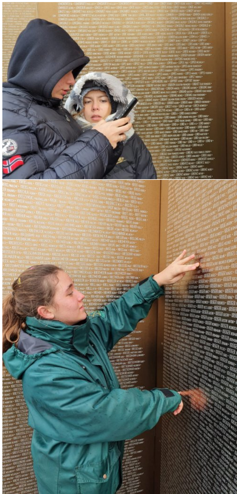
Le cimetière français :