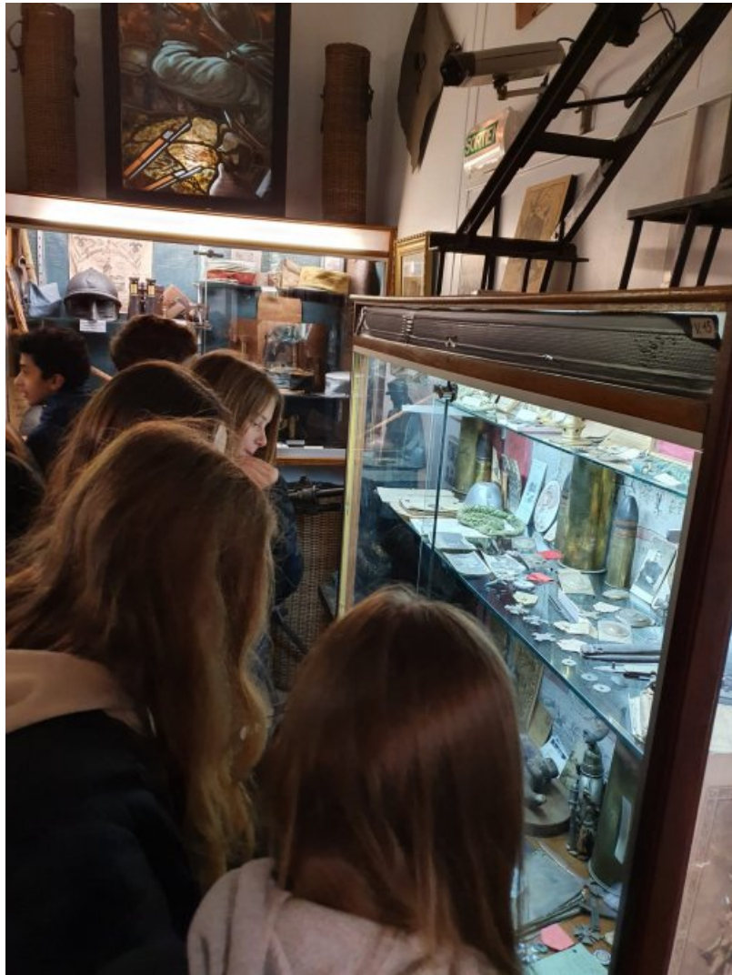
Route vers Vimy. Les tranchées :