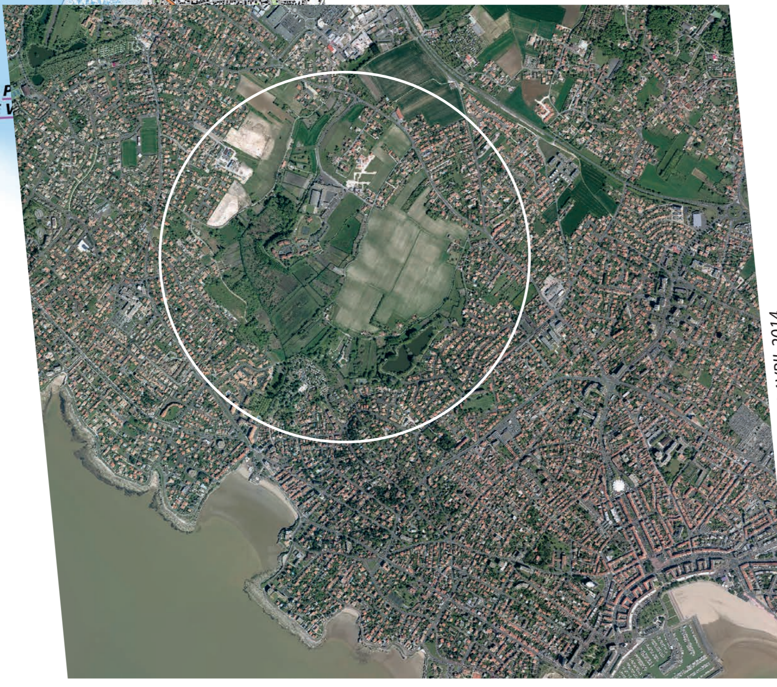
Ortho 2014